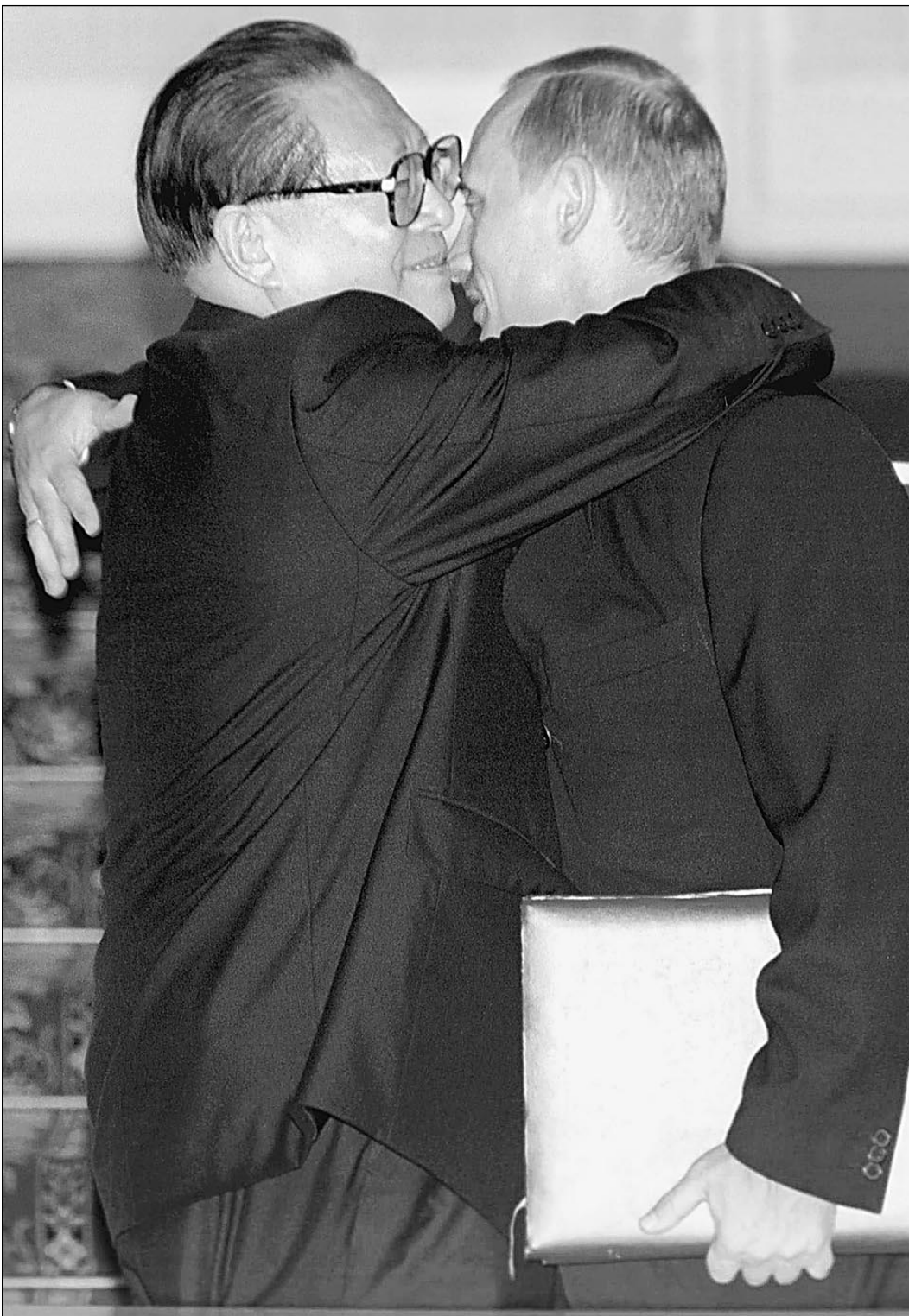
Цзян Цзэминь и Владимир Путин скрепили Договор о дружбе троекратным поцелуем

Россия и Китай ищут пространство свободы