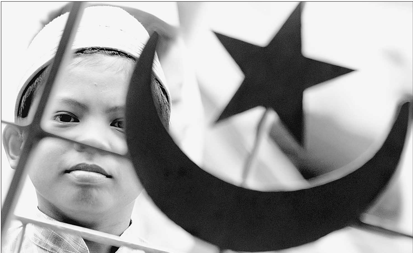
Атрибуты новой российской политкорректности

Спасет ли Россию создание какого-нибудь совета по этнической толерантности от межнациональных распри, позволит ли ей и дальше оставаться многонациональной и многоконфессиональной страной? В богатой истории нашей страны терпимость к инстинктам соседям всегда была исключением, позволявшим выжить и тем, и другим. Однако вслушайтесь в слово «терпимость»: в нем прямо-таки просвечивает вынужденность. А ну как терпение иссякнет? Это и тревожит приезжих с Юга и Востока. Участники «круглого стола», исполненные обиды, ни разу не произнесли термина «политкорректность». Однако по сути дела они требовали именно ее — перенесенной на российскую почву уважительной презумпции гражданских прав и свобод любого россиянина. Российскую модель политкорректности нам предстоит выработать долгие годы, но пусть лучше этот процесс начнется с «круглого стола», чем с какого-нибудь самосуда над «лицами кавказской национальности».