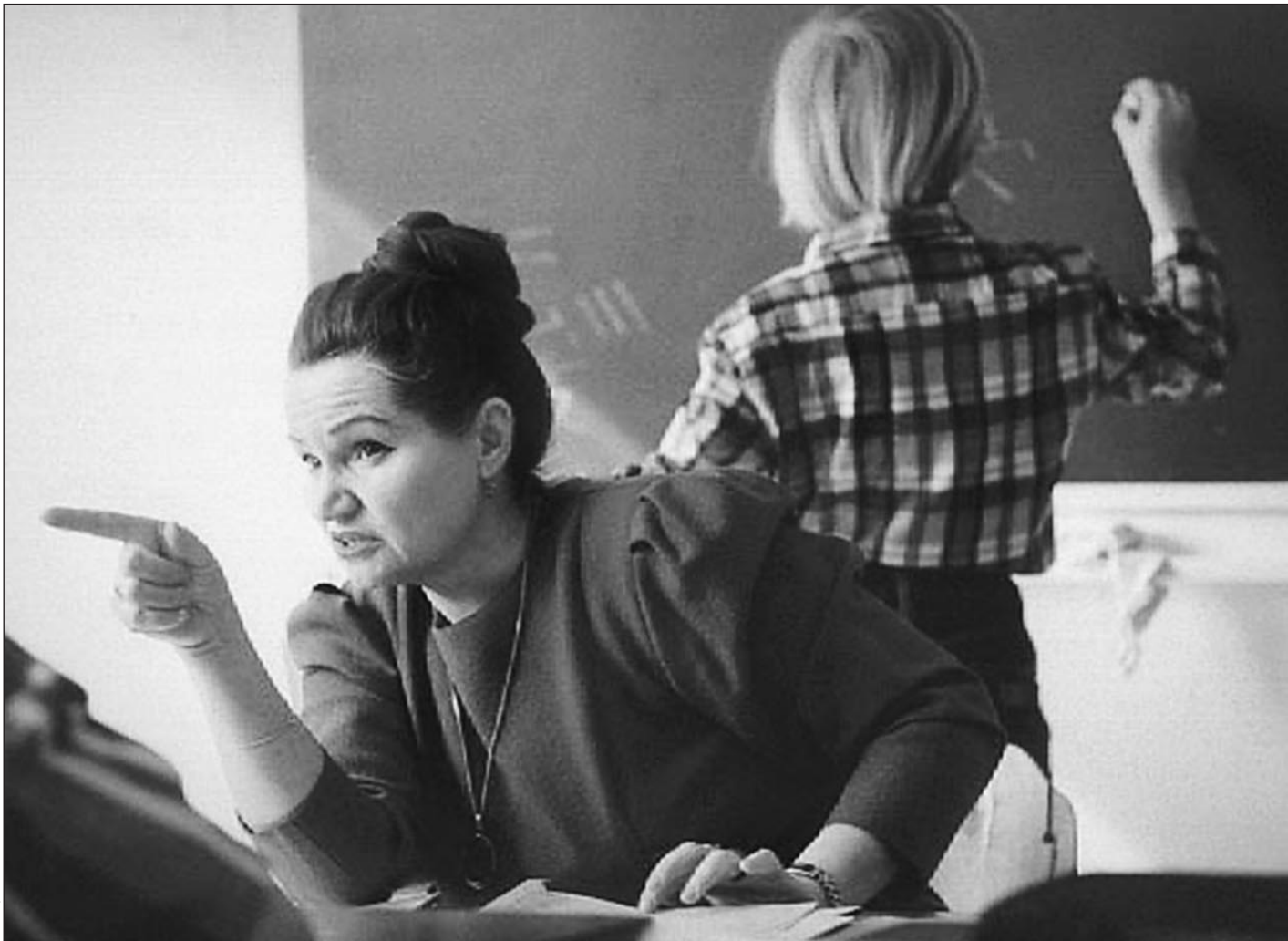
Ты записался в медалисты?