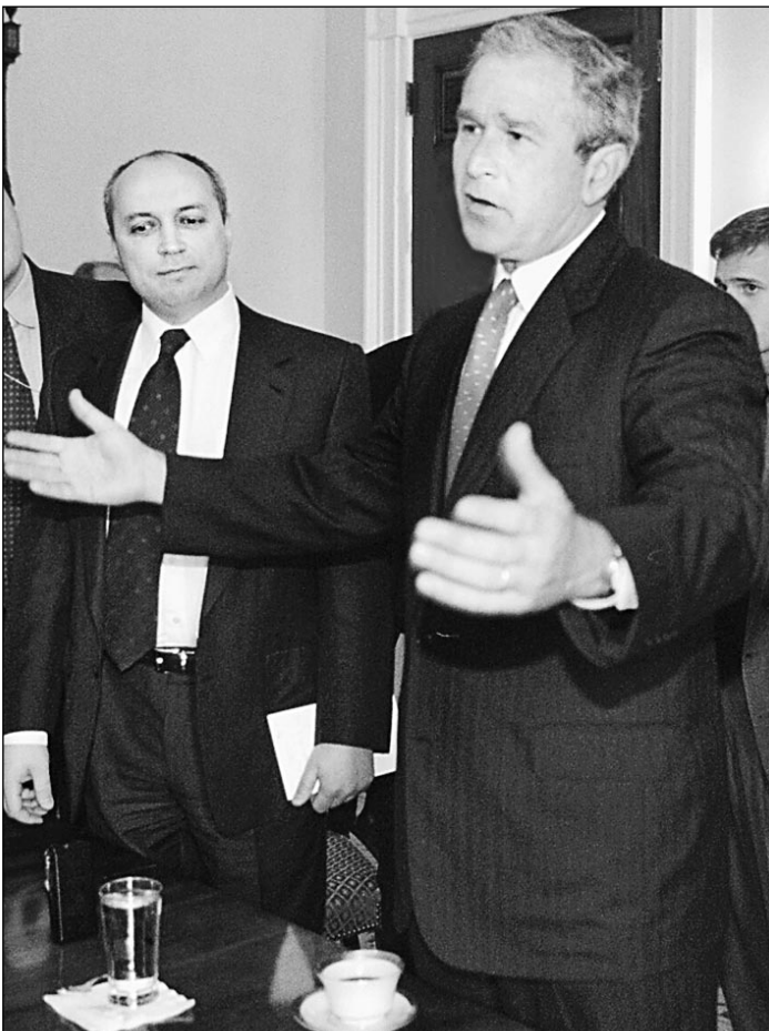
Американский президент проявляет русское радушие