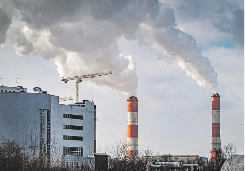
Константин Кошкин / «Известия»