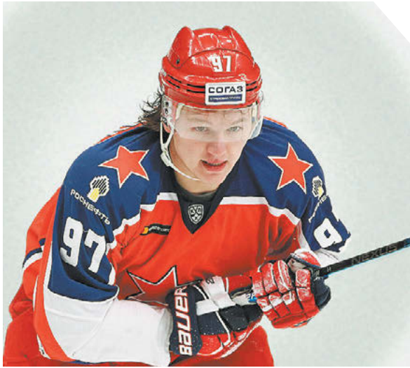
Дарья Исаева «СЗ» / Canon EOS-1D X Mark II