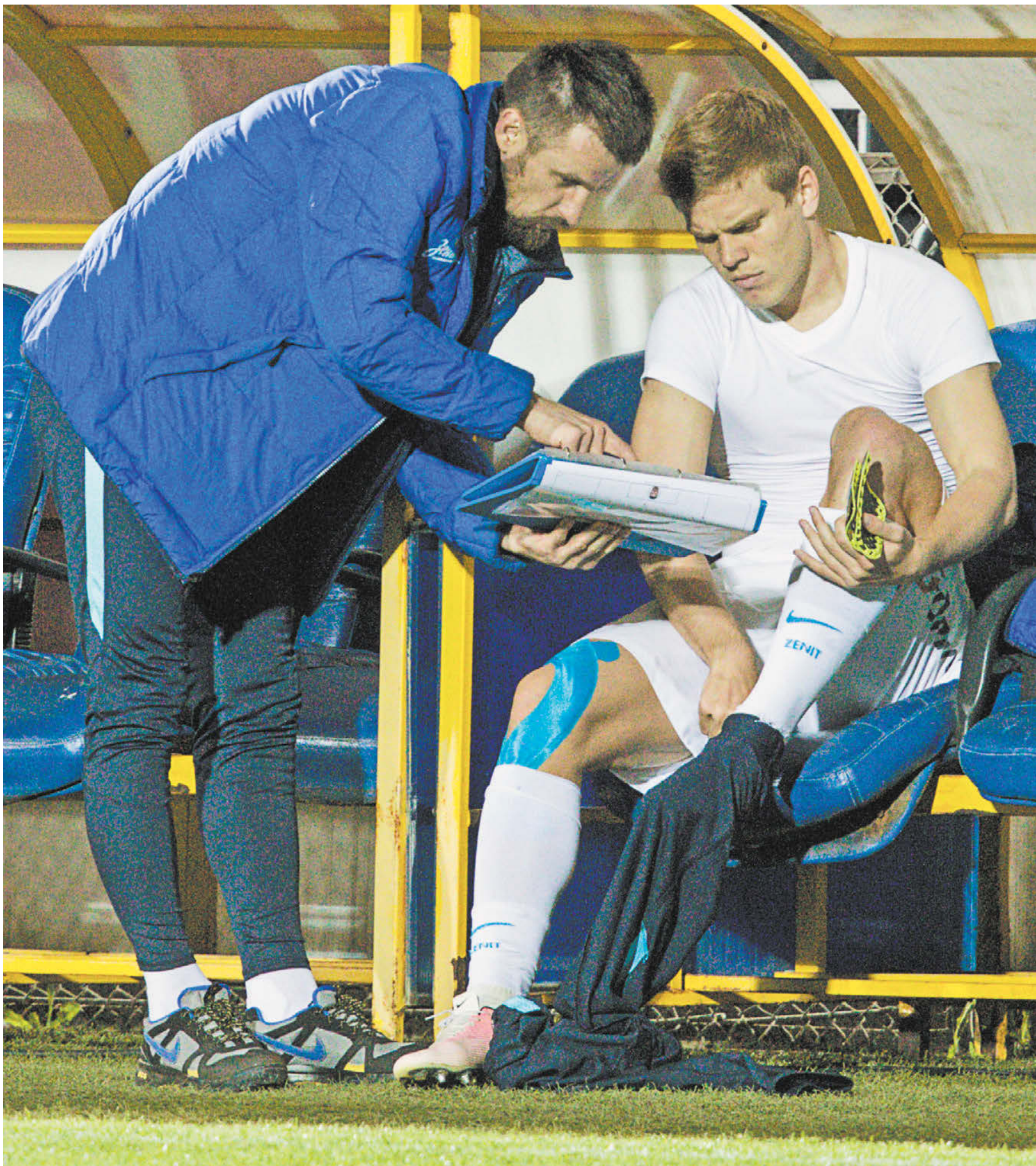
Главный тренер «Зенита» Сергей Семак (слева) ждет назад нападающего Александра Кокорина

Эксклюзивное интервью главного тренера сине-бело-голубых, который 1 июня заключил с невским клубом новый контракт по схеме «2+1»