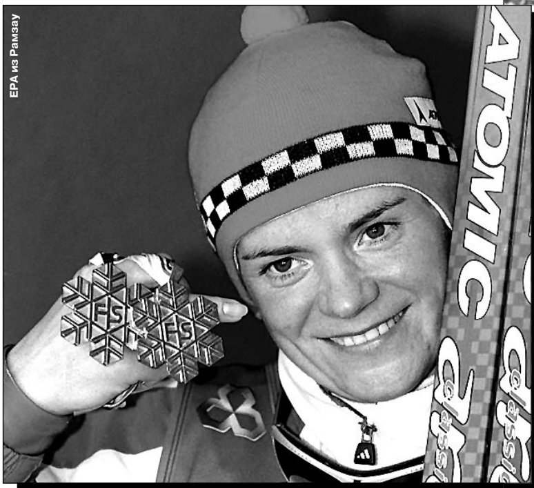
Подробности - в репортаже из Рамзау специального корреспондента «СЭ» Елены ВАЙЦЕХОВСКОЙ - стр. 14

В субботу в Рамзау Лариса Лазутина, победив с огромным преимуществом в гонке на 30 км, завоевала свою девятую золотую медаль на чемпионатах мира, причем пятую - в индивидуальных дисциплинах. Это второй результат в истории женского лыжного спорта. Столько же побед у самого титулованного из мужчин - норвежца Бьорна Дэли.