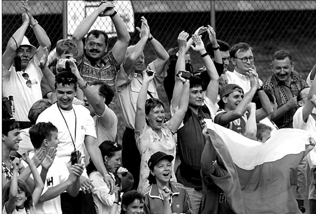
Российские болельщики, добравшиеся до карликового государства в Пиренеях, радуются победе своей сборной на трибунах стадиона в Андорре-ла-Велья.