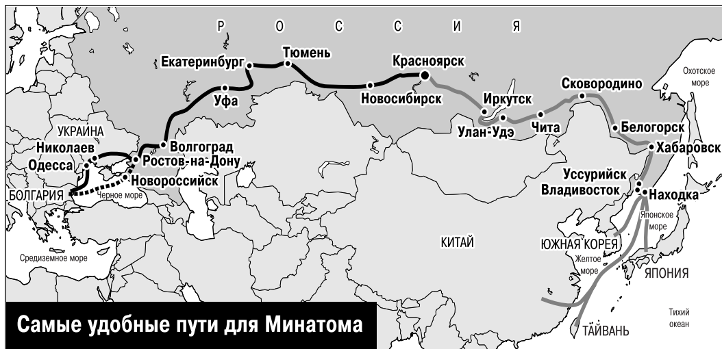
Самые удобные пути для Минатома