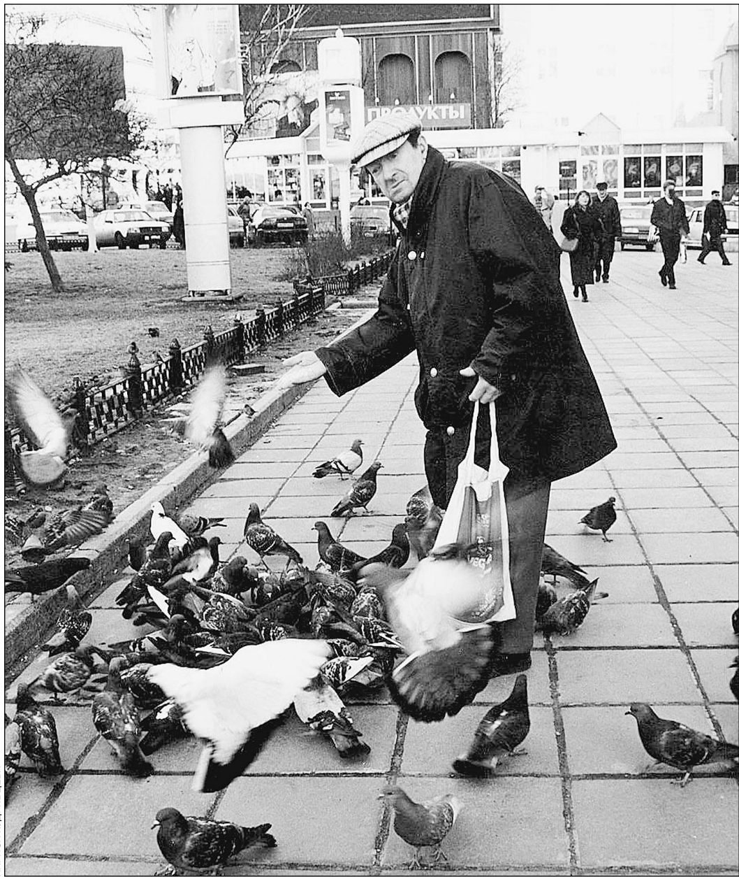
Георгий Вицин любил кормить голубей

Великие Шуты эпохи — они же ее Трагики. Сегодня у нас печальный День Вицины. Сегодня у нас и День Райкина, о котором вспоминаем с теплом и грустью. Эпохи уходят — Шуты остаются.