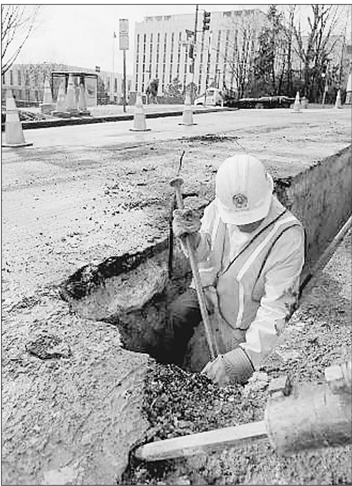
Контора Глубокого Бурения

Последняя массовая депортация российских представителей была при президенте Рейгане в 1986 году: тогда из США выслали 80 человек. По мнению Вашингтонских источников «Известий», на сей раз список жертв «был составлен недели две назад, но ждали окончания визита секретаря СБ Сергея Иванова». Визит, надо признать, был неудачным: полное