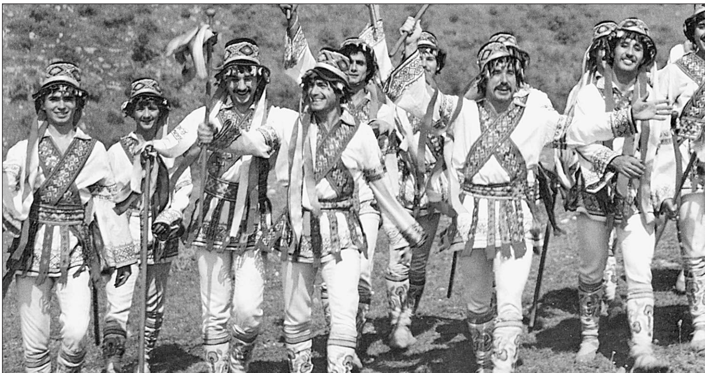
Молдавия: танцуют все!

Кстати, на вещи можно взглянуть и по-другому: 50 процентов молдаван голосовали против коммунистов. Просто сыграл свою роль хорошо известный россиянам «проходной барьер» — в Молдавии он даже выше, чем у нас: не 5 процентов, а 6. Противники коммунистов слишком распылили свои силы — и поплатились за это. В парламент прошли лишь три партии, все остальные не сумели преодолеть магический