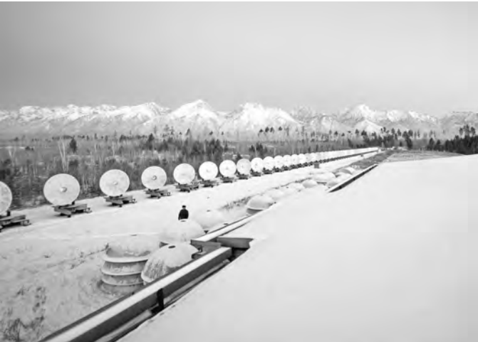
ИСУФ СО РАН

В поселке Бандары (Республика Бурятия) будет построен новый многоволновый радиогелиограф. Сейчас здесь действует уникальный 256-антенный Сибирский солнечный радиотелескоп (ССРТ). Новый радиогелиограф позволит с высокой точностью измерять магнитные поля в короне Солнца и, таким образом, прогнозировать солнечную активность.