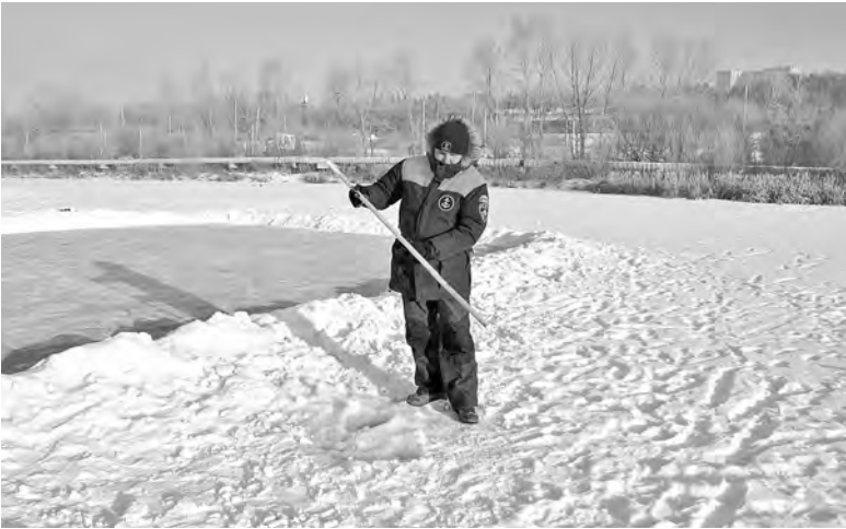
МЧС ИРКУТСКОЙ ОБЛАСТИ

— Как раз в тот день в новостях передавали, что в Ленинском районе Иркутска МЧС закрыло похожий любительский каток, устро-