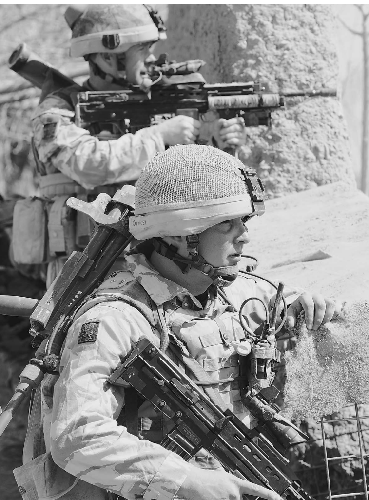
Американский спецназ идет на штурм позиций талибов

Началось «генеральное наступление» на талибов