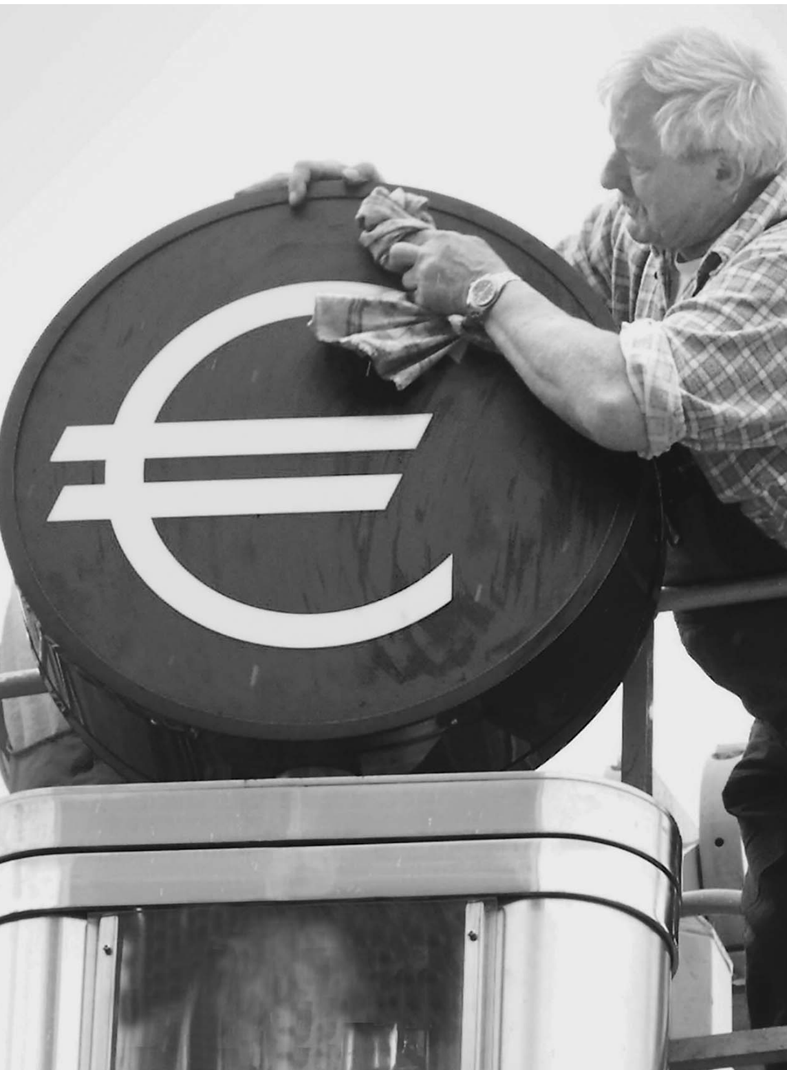
Наводить лоск на любимое детище в Европе больше не хотят: это просто невыгодно

Обвалить евро хотят и бизнесмены, и власти Евросоюза