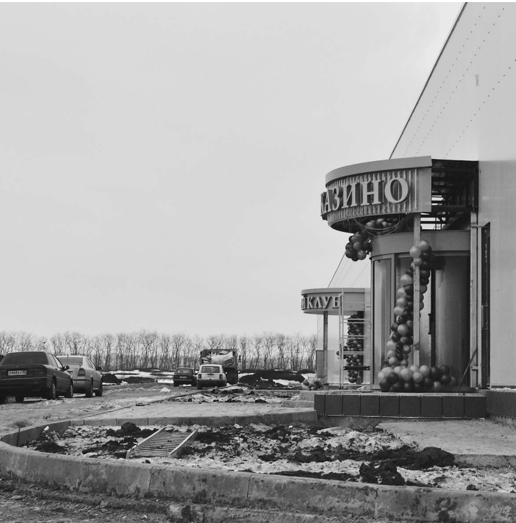
Снаружи первое российское казино выглядит не комильфо. Открытие состоялось, шарик сдулся, асфальт еще не положили