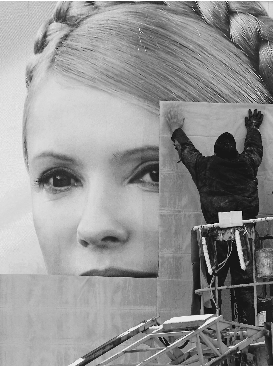
Пока Юлия Тимошенко готовит людей к новой «цветной революции», плакаты с ее изображением стремительно исчезают с киевских улиц

Виктор Янукович выигрывает, а Юлия Тимошенко не признает поражения