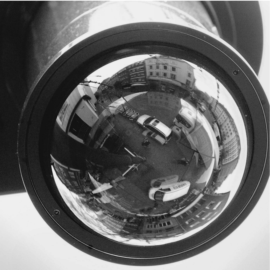
В скором времени камеры слежения установят на всех перекрестках России

Видеофиксация дорожных нарушений охватывает все новые километры трасс. Татарстан, Краснодарский край, Ставрополье — квитанции на штрафы с фотографиями находят в почтовых ящиках сотни тысяч человек. Вскоре видеокамеры будут фиксировать не только превышение скорости и проезд на красный, но и выезд на встречную полосу и разворот через две сплошные. Чтобы понять, как работает эта система, корреспондент «Известий» отправился в центр видеофиксации ГИБДД Подмосквья, где два года назад распечатали первые в России штрафные фотоквитанции.