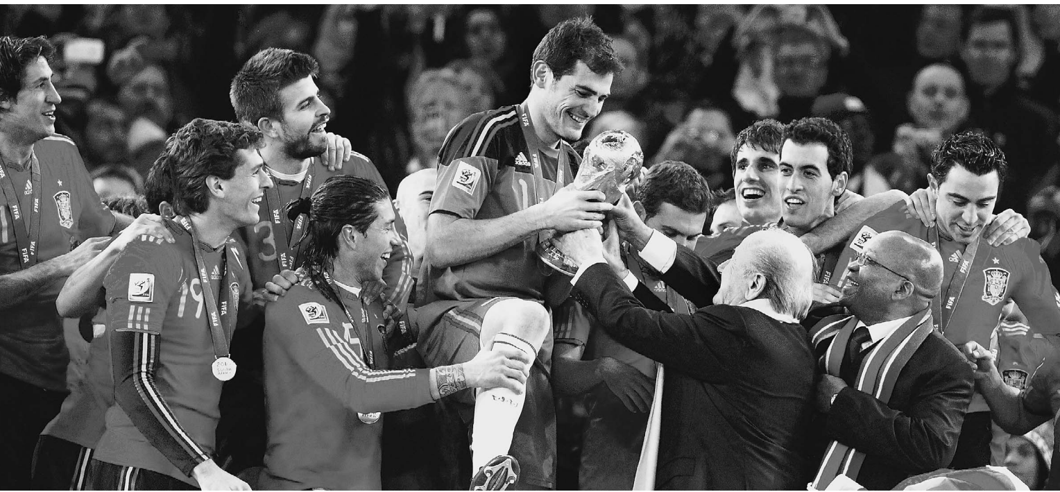
Чемпионский трофей впервые в истории достался испанской сборной

Футбольный чемпионат мира в ЮАР завершен