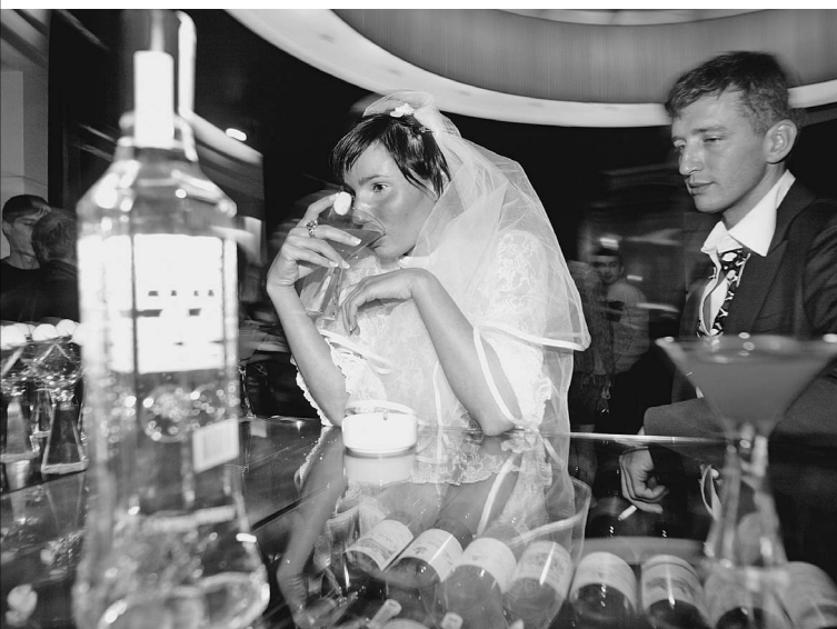
«Беленькая» начинает ломать семью уже на свадебной церемонии