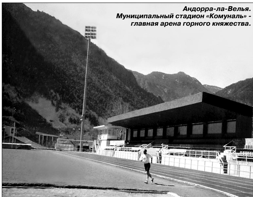
Андорра-ла-Велья. Муниципальный стадион «Комуналь» - главная арена горного княжества.

Андорра-ла-Велья. Стадион «Комуналь». СЕГОДНЯ. 20.30 (время московское)