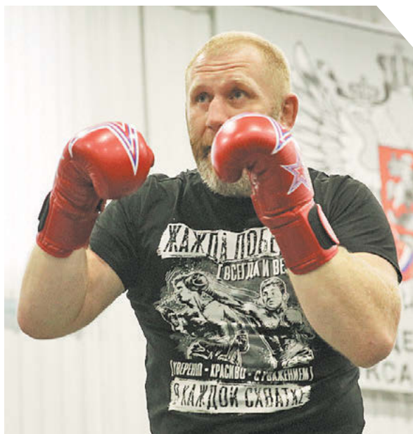
Зураб Джавахадзе / «Известия»