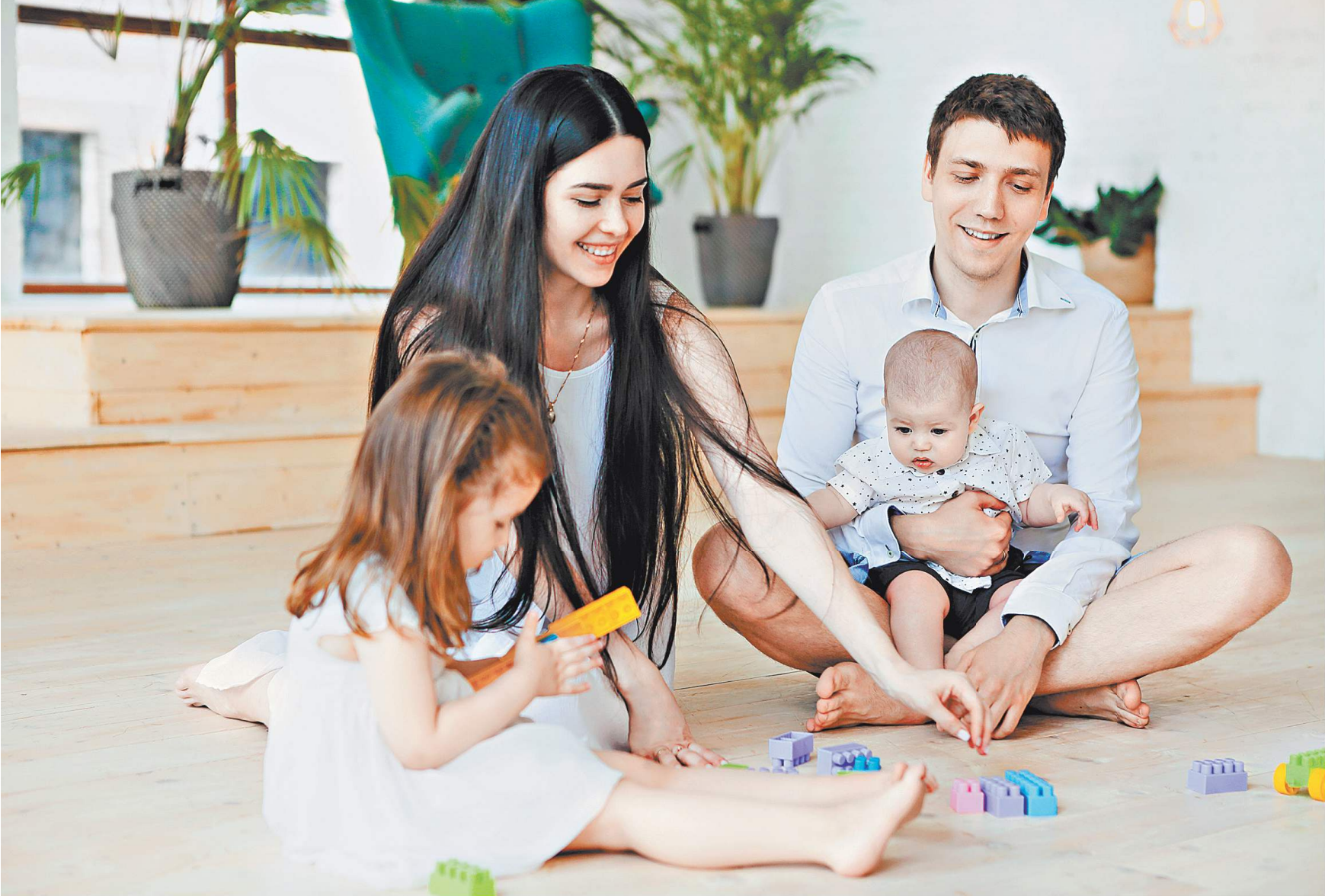
Сегодня в России насчитывается 25,7 тысячи студенческих семей. В 5,6 тысячи из них уже воспитываются дети.

Соавтор законопроекта, член Комитета Госдумы по защите семьи, вопросам отцовства, материнства и детства Ольга Коробова, уточнила, что в новую категорию смогут попасть не только студенты, но и