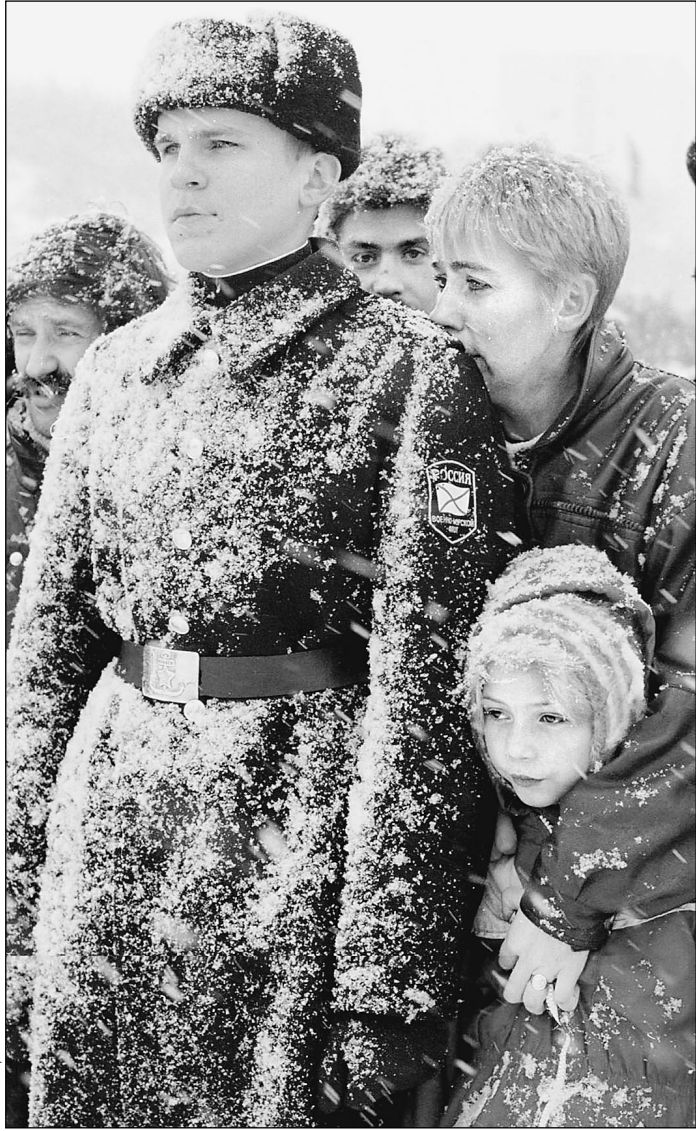
29 октября 2000 года. Североморск. Траурная церемония

«Благородно только то, что бескорыстно». Жан де ЛАБРИЮЕР