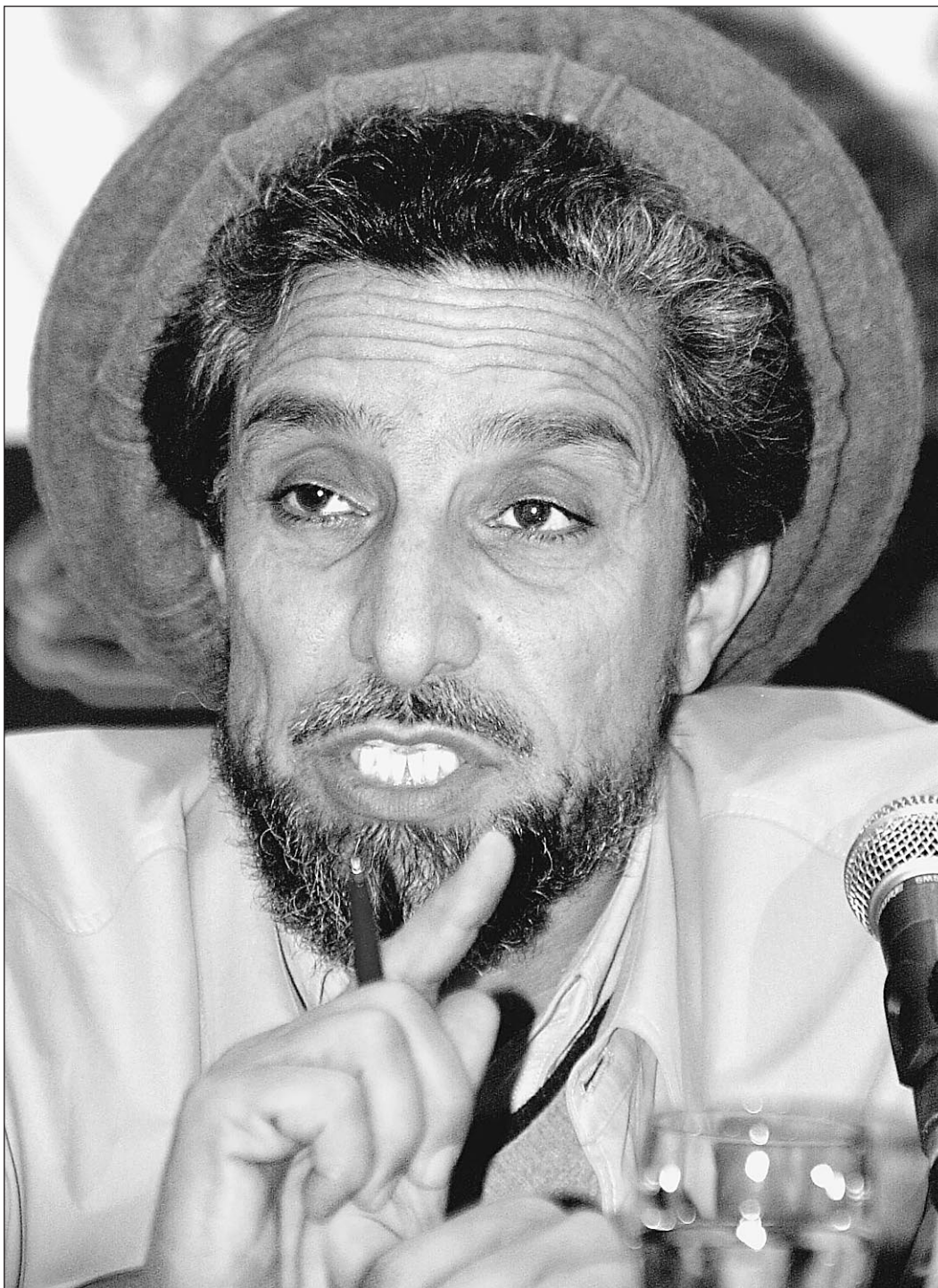
Ахмад Шах Масуд — последний защитник южных границ СНГ