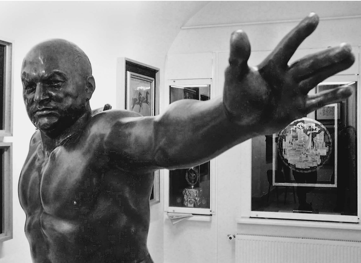
О том, чтобы увековечить себя в бронзе, Юрий Лужков позаботился еще до отставки

Список кандидатов на пост столичного мэра продолжает пополняться