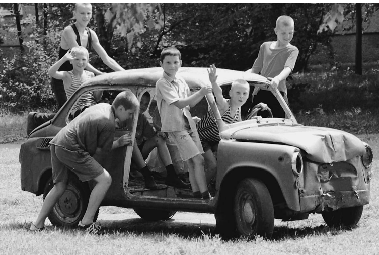
На учете в ГИБДД по-прежнему стоит масса развалюх, большая часть которых уже не на ходу

ОФИЦИАЛЬНЫЕ (ЦЕНТРАЛЬНЫЙ БАНК РФ) КУРСЫ ВАЛЮТ К РУБЛЮ НА 1 ОКТЯБРЯ