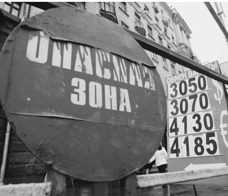
Обмен денег перестал быть рискованной операцией