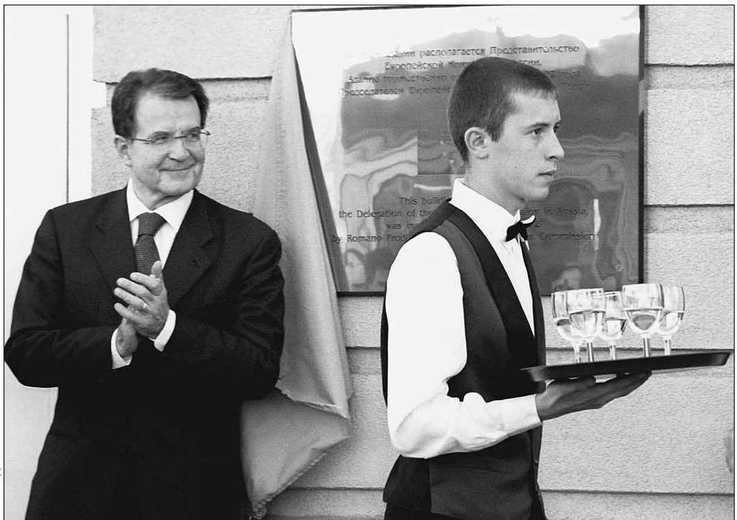
29 мая. Москва. Открытие представительства Еврокомиссии. Романо Проди аплодирует русскому гостеприимству