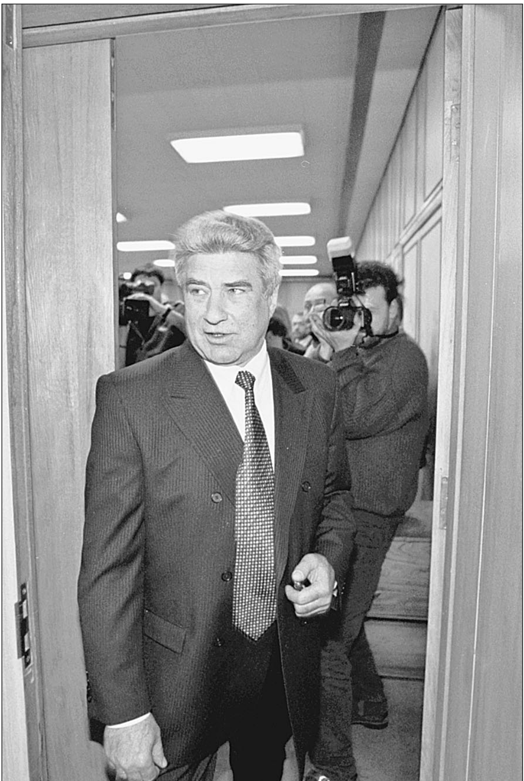
Геннадий Ходырев — беспартийный, губернатор Нижегородской области