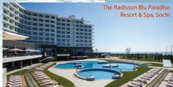
The Radisson Blu Paradise Resort & Spa, Sochi