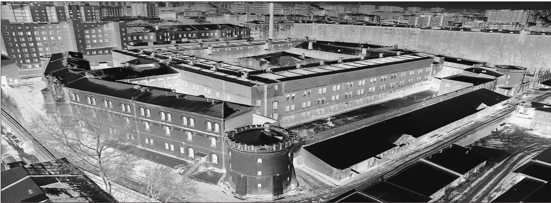
Бутырская тюрьма. Памятник архитектуры XVIII века. 5 сентября 2001 года отсюда бежали трое заключенных

паде инициировать расследования по поводу «русских» денег заканчивались ничем, так как по российским законам все чисто. Теперь же заключение FATF дает формальный повод западным службам и банкам отказывать россиянам в открытии счетов, покупке недвижимости и других финансовых операциях. Или требовать подтверждения чистоты денег по западным, а не по российским меркам — наше-то законодательство не признается соответствующим их стандартам. Вот против введения подобных санкций, что после сегодняшнего решения FATF становится реальным, и планируют власти России организовать все возможные действия и по дипломатическим каналам, и по линии сотрудничества спецслужб. Тем более что уже есть прецеденты, когда российские граждане, пытавшихся открыть счет за рубежом, просят предоставить миллиейскую справку о происхождении денег.