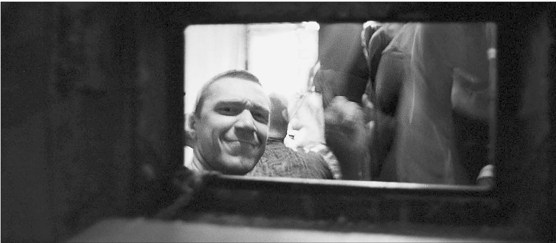
Трезвый взгляд на свободу

Из российских тюрем бежали, бегут и будут бежать