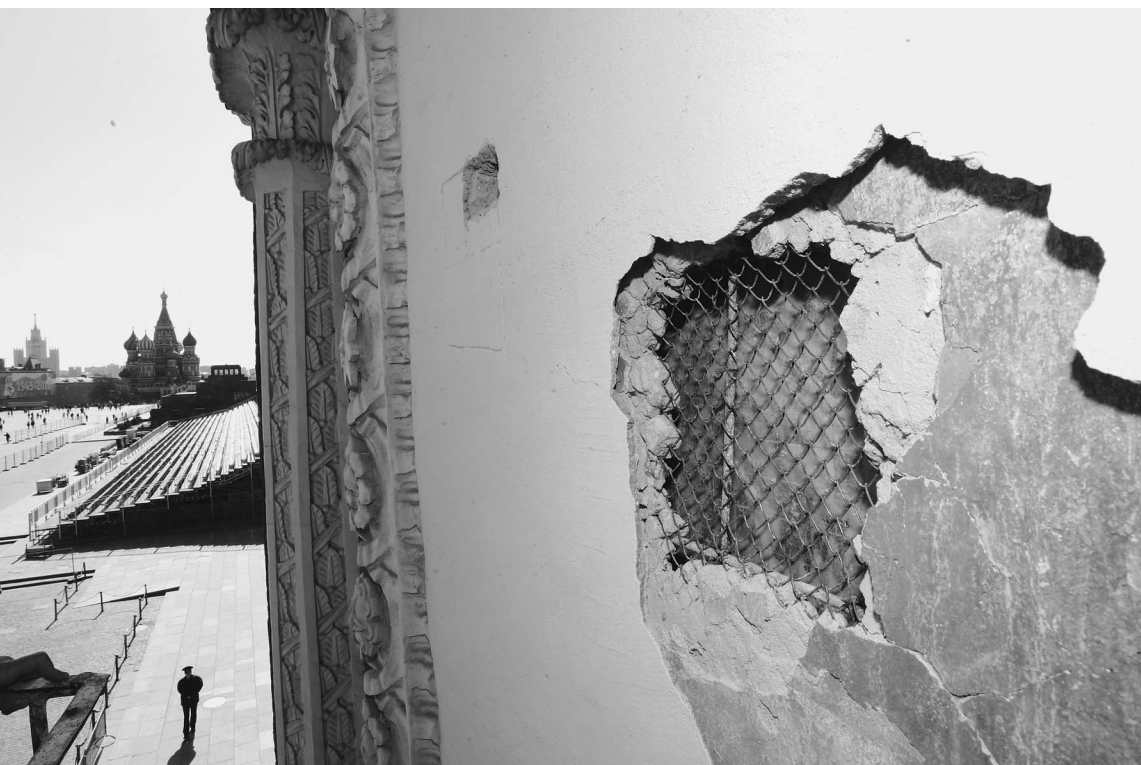
В годы становления советской власти иконы на башнях Кремля тщательно замуровали. Сейчас реставраторам придется «избавляться» от этого наследия