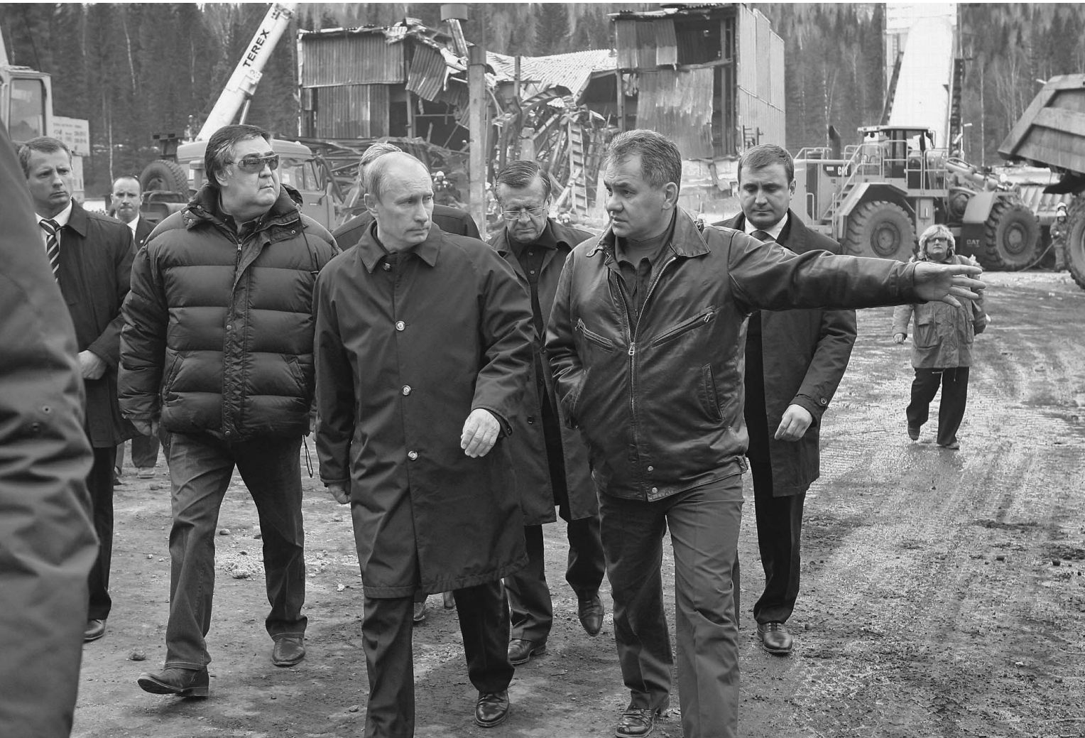
Премьер в сопровождении кемеровского губернатора Амана Тулеева, Виктора Зубкова и Сергея Шойгу осматривает место трагедии

Премьер Владимир Путин лично разбирался, почему после первого взрыва под землю спустились люди