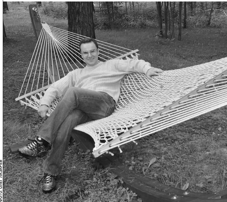
Губернатор Тверской области Дмитрий Зеленин заработал в прошлом году гораздо больше своих коллег

Дмитрий Медведев вчера в Дамаске провел переговоры с президентом Сирии Башаром Асадом. Как подчеркнул Асад, визит российского коллеги — историческое событие.