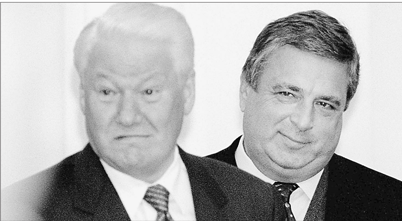
Теория происхождения власти (фото из «семейного» альбома)

Складывается впечатление, что Путин задумывается об обновлении своей команды и «закрытии счетов» с ельцинскими. Первые наметки проявились осенью, когда в ходе избирательной кампании в США была выдана на свет тема коррупции в России. Явные (и трудно объяснимые рационально) симпатии части нынешнего руководства к партии Буша лишь подчеркивали, что путинское окружение делится на две части — «замешанных» в ельцинском прошлом и тех, кто был в стороне на пиру «тех» олигархов. Тогда мелькнула мысль, что объективно (подчеркнув, вне зависимости от осознания этого самим Путиным) новый президент