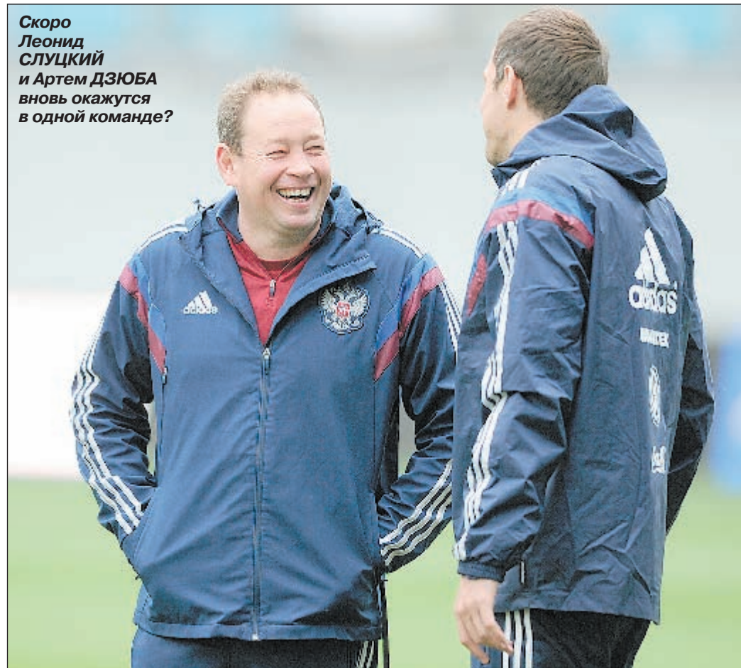
Скоро Леонид СЛУЦКИЙ и Артем ДЗЮБА вновь окажутся в одной команде?