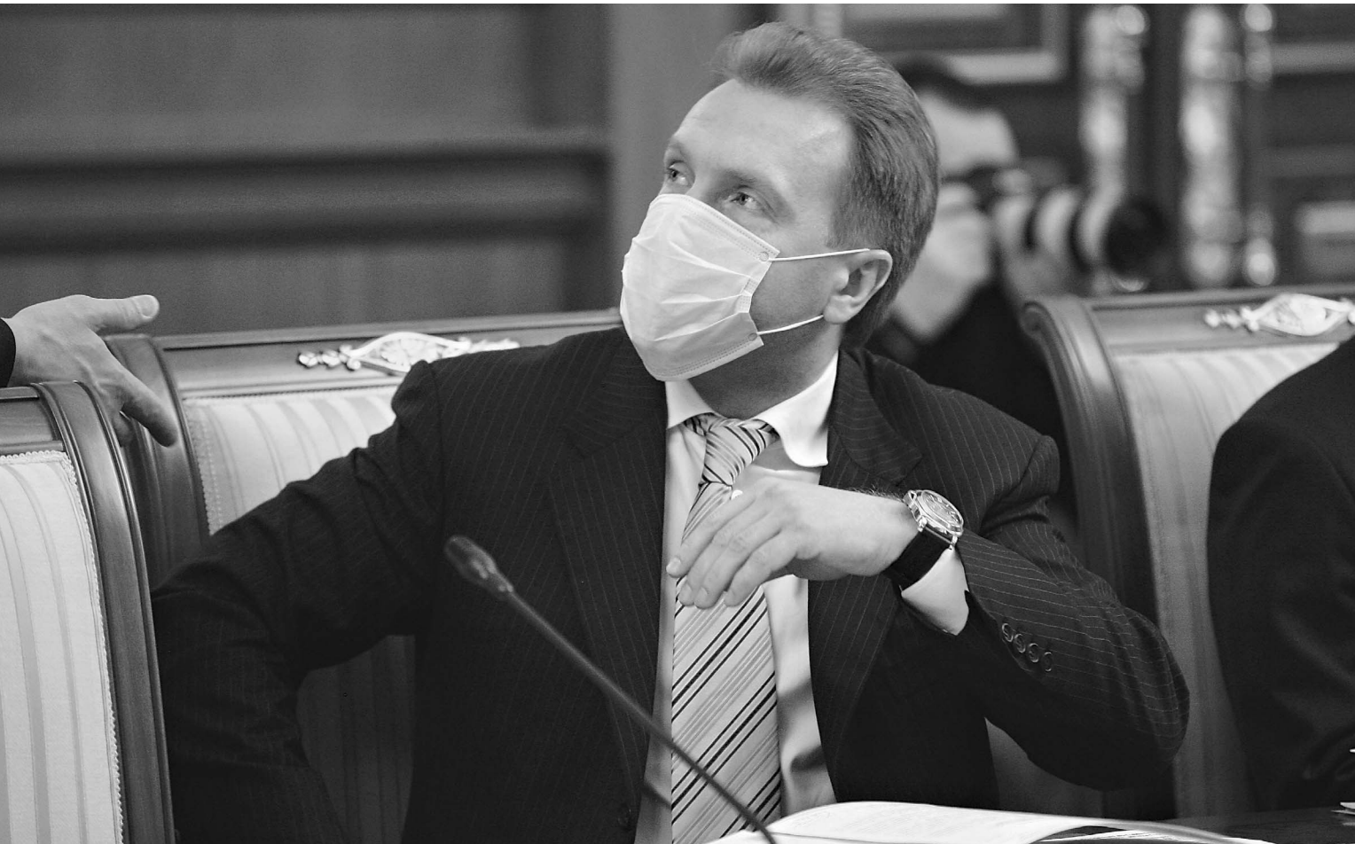
Первый вице-премьер Игорь Шувалов предложил защиту от спекулянтов

Власти объявили «крестовый поход» против спекулянтов, повышающих цены на продукты