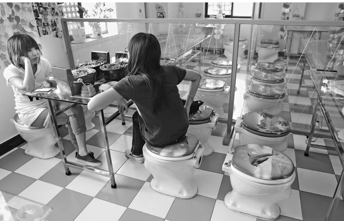
В скором времени ставить туалеты где попало будет нельзя