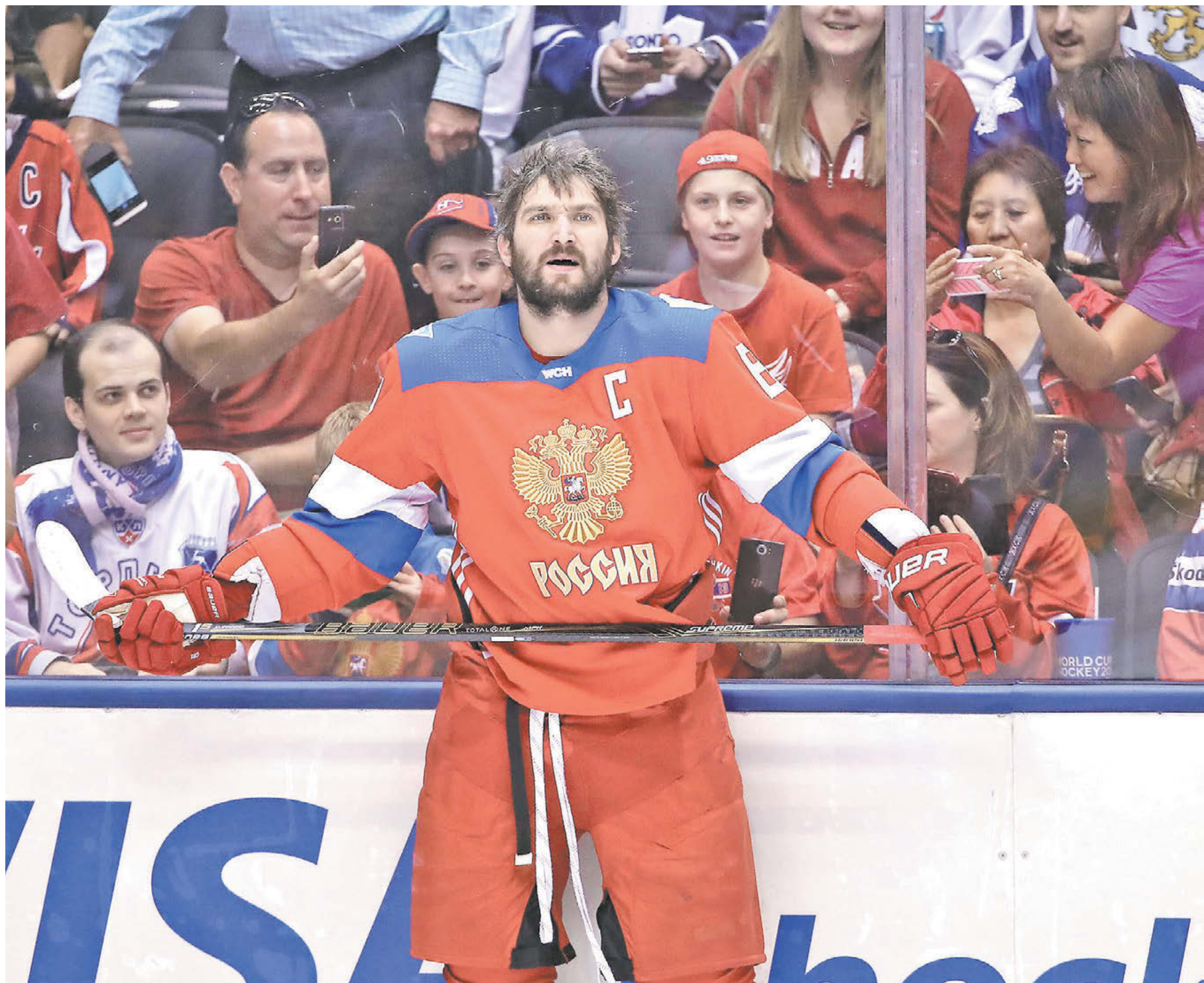
Александр Овечкин с очень большой долей вероятности не сможет помочь сборной России на следующем чемпионате мира

Глава Международной федерации хоккея развеял слухи о переносе ЧМ-2023 из России в Швейцарию, рассказал о возможном сдвиге ЧМ-2021 из-за смещения сроков сезона НХЛ, а также заявил, что продолжит возглавлять ИИХФ еще год из-за форс-мажорной ситуации