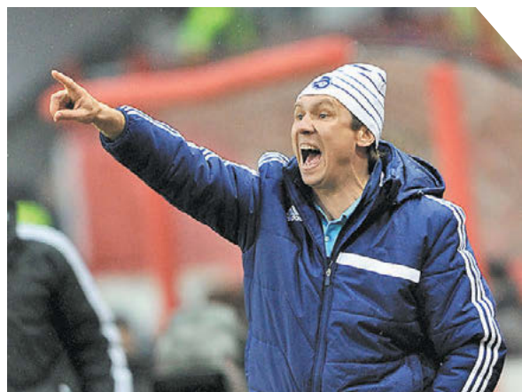
Александр Федоров «СЗ» / Canon EOS-1DX Mark II