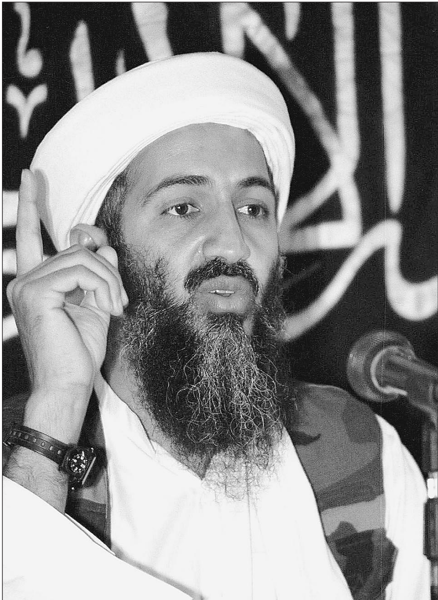
Осама. Слуга дьявола

Более того: не имеет политического значения, жил ли бен Ладен или давно нашел свою смерть где-нибудь в пещерах Тора-Бора, разрушенных американскими глубинными бомбами. Осам давно уже превратился в информационный миф, созданный обоюдными усилиями враждующих сторон — американской сверхдержавы и всемирного терроризма. Медийный миф обрел реальные очертания, он живет собственной жизнью — угрожает Америке новыми терактами, требует от Джорджа Буша «уйти с Аравийского полуострова и перестать поддерживать трусливых евреев», прославляет «мучеников 11 сентября».