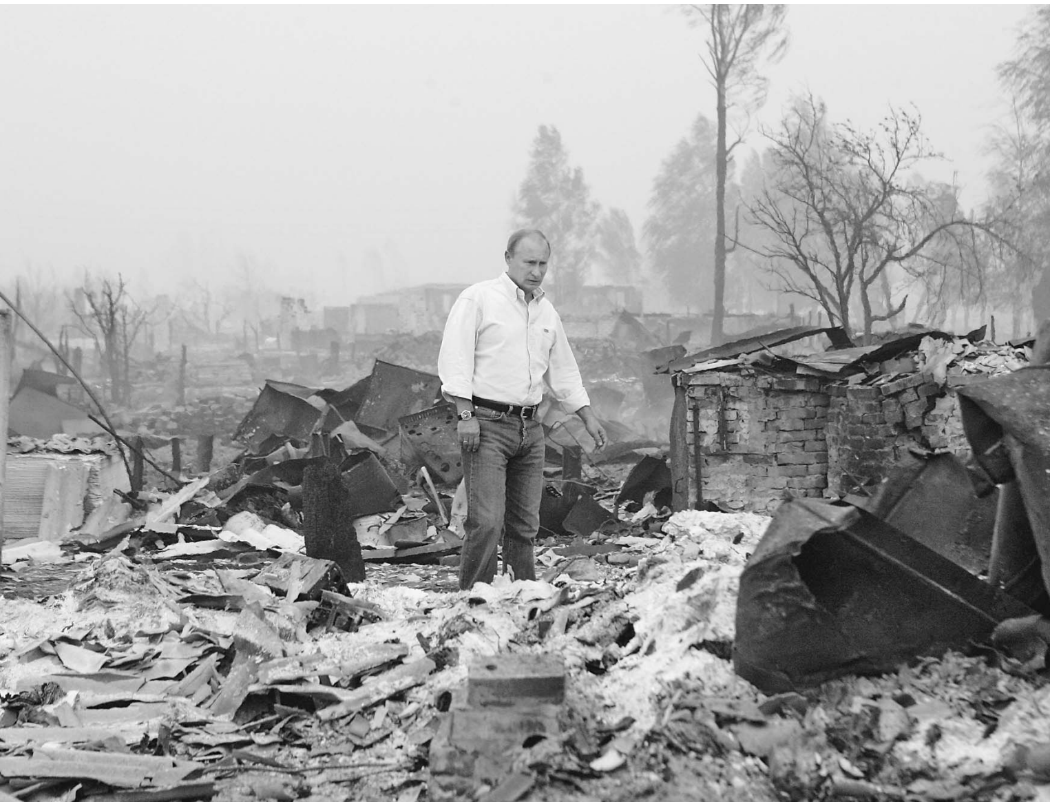
Владимир Путин посетил сгоревшее село Верхняя Верея в Нижегородской области. Премьер обещал погорельцам — новые дома до начала зимы и ощутимую финансовую помощь каждому пострадавшему от пожара

Стихия охватила центральную часть страны накануне августа — самого непредсказуемого месяца в России