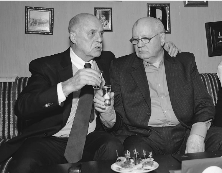
Водка — непреодолимая ценность российской элиты (на снимке — режиссер Станислав Говорухин и экс-президент СССР Михаил Горбачев)