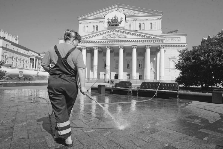
Кадровые чистки также привычны для Большого, как ежедневная уборка театральной территории