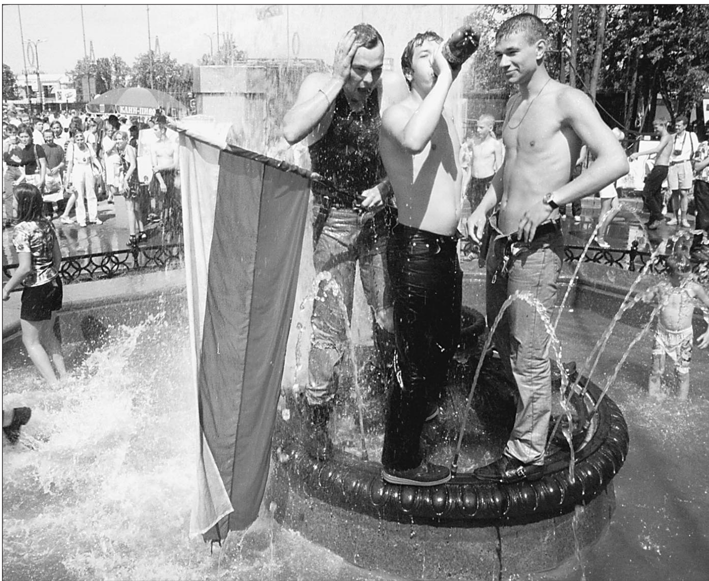
12 июня 2000 года. Москва. Народ празднует День России

Волгоград — далеко не единственный город России, страдающий от троллейбусного ванда-