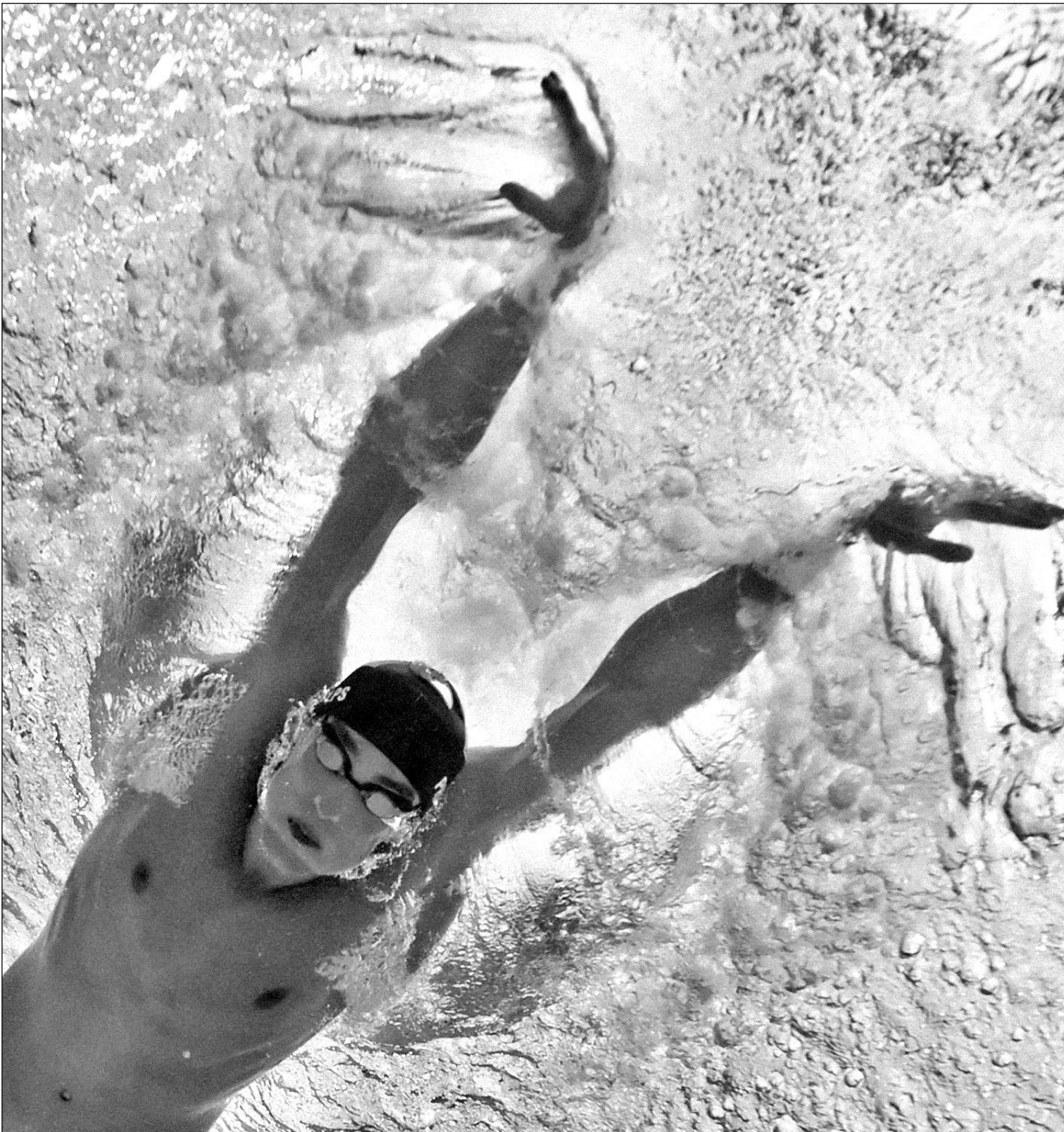
Первый в истории 11-кратный олимпийский чемпион - великий Майкл ФЕЛПС.

Кроме того, два моих друга прилетели сюда вчера, и я успел их повидать. Они рассказывают, что в Штатах все с ума посходили. Один из них живет в Нью-Йорке и говорит, что в «Нью-Йорк тайме» каждый день пишут обо мне полосами. Классное ощущение - знать, что в каком-то уголке планеты ты ны выступал, народ смотрит и болеет за тебя. Поддержка из дома мощна настолько, что я чувствую ее даже здесь, на противоположном конце Земли.