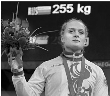
СЕРЕБРО Оксана СЛИВЕНКО, тяжелая атлетика, 69 кг