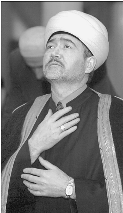
Глава Совета муфтиев России Равиль Гайнутдин

Детали переговоров можно узнать в нашей рассылке. Подробности на 2-й стр.