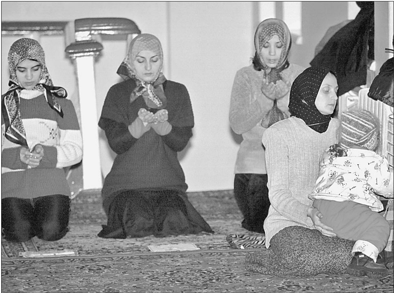
14 февраля. Москва. Российские паломники. Они могут совершить хадж только в сопровождении мужчин. Рector Московского исламского университета Марат Муртазин заявил «Известиям»: «Женщины могут и совершают хадж, после совершения всех обрядов они называются «хаджиями» и во время паломничества совершают все те же действия, что и мужчины»

Детали переговоров можно узнать в нашей рассылке. Подробности на 2-й стр.