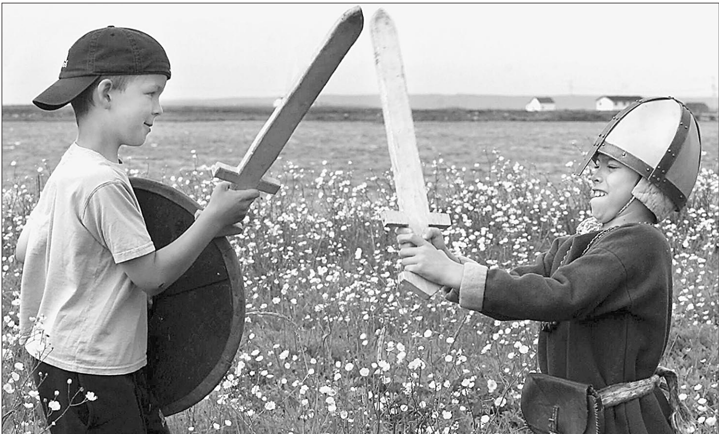
Добрыня Никитич и Алеша Попович. Молодые годы

Трагедия произошла еще 12 февраля, а в Ставрополе, куда в