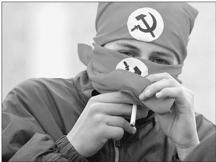
Форма одежды — любая

Правительство утвердило федеральную программу патриотического воспитания граждан и выделяет деньги на формирование положительного имиджа России за рубежом. Утверждение текста гимна Сергея Михалкова в честь за музыкой Александрова должно знаменовать преемственность традиций великой, как считается власть, державы. Юбилей Петербурга — родного города президента — обещает стать демонстрацией новой русской великодержавности. «Известия» попробовали разбираться, что такое российский патриотизм сегодня — 13 марта 2001 года.