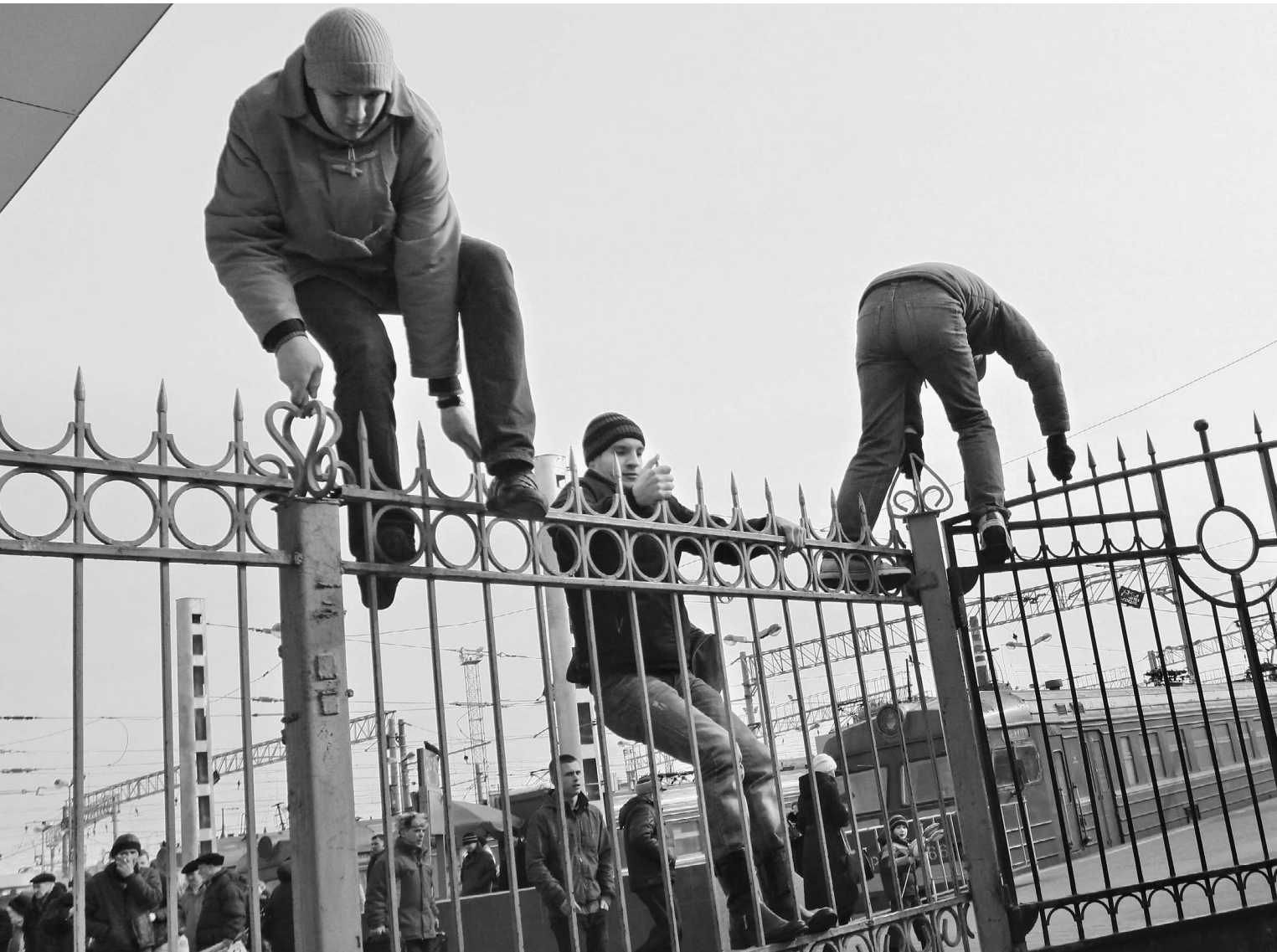
Попытка остановить таких людей может стоить жизни

На вокзале в центре Москвы безбилетник убил машиниста, сделавшего ему замечание