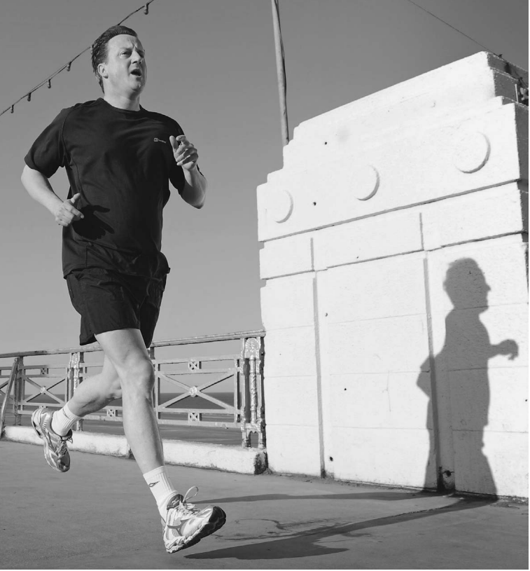
Дэвид Кэмерон выиграл главный забег в своей жизни