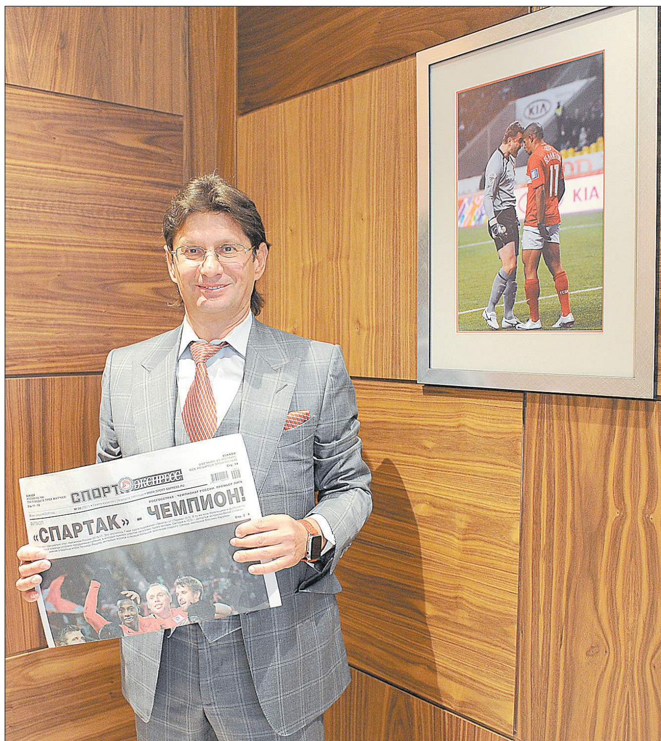
Вчера. Москва. Владелец «Спартак» Леонид ФЕДУН с чемпионским номером «СЭ» от 10 мая.

Вчера владелец «Спартак» принял у себя журналистов «СЭ» и дал большое эксклюзивное интервью