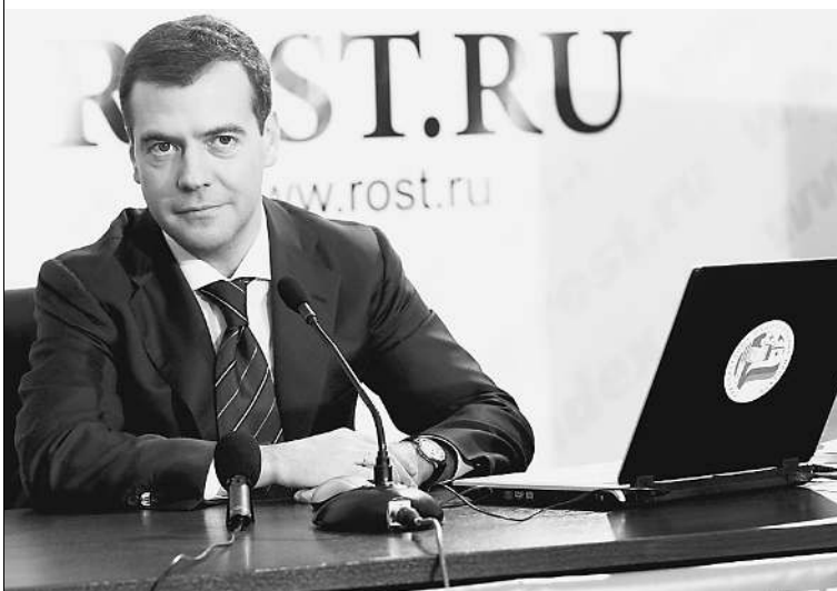
Дмитрий Медведев ответил на 43 вопроса

«Вы говорили, что в фармацевтике сконцентрировались жулики, можете назвать конкретные имена?» — этот вопрос был задан одним из первых. Имена Медведев, сославшись на свое юридическое образование, называть отказался — сначала вину должен признать суд. Тем не менее, заверил он, сейчас по ряду случаев ведется следствие. Зато куда более жестко тема лекарств прозвучала уже в самом конце, когда свои вопросы первому вице-премьеру задавали присутствовавшие в Медиа-центре «Известий» журналисты. → стр. 2