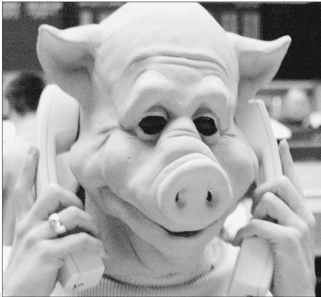
В современном мире связь делает человека человеком

Для части «народной» экономики введение «повременки» означает неполучение и без того малых доходов и неизбежное вовлечение в игру всевозможных политиков, зарабатывающих на данной проблеме пресловутый политкапитал. Два мира, две системы.