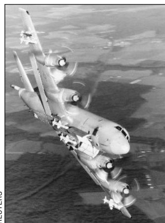
Такой самолет-разведчик США вынужденно приземлился в КНР

Инцидент с американским самолетом-шпионом EP-3, которому вместе с экипажем из 24 человек пришлось сесть на китайском острове Хайнань, грозит резким обострением и без того натянутых отношений двух ядерных держав.