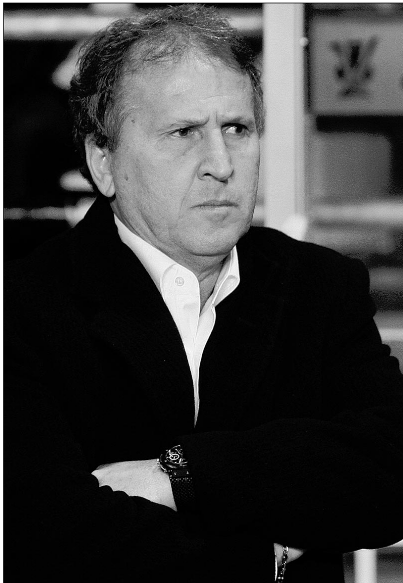
Среда. Бирмингем. «Астон Вилла» - ЦСКА - 1:1. ЗИКО.

По итогам первых матчей 1/16 финала Кубка УЕФА корреспонденты «СЭ» задали 5 вопросов главным тренерам ЦСКА и «Зенита»