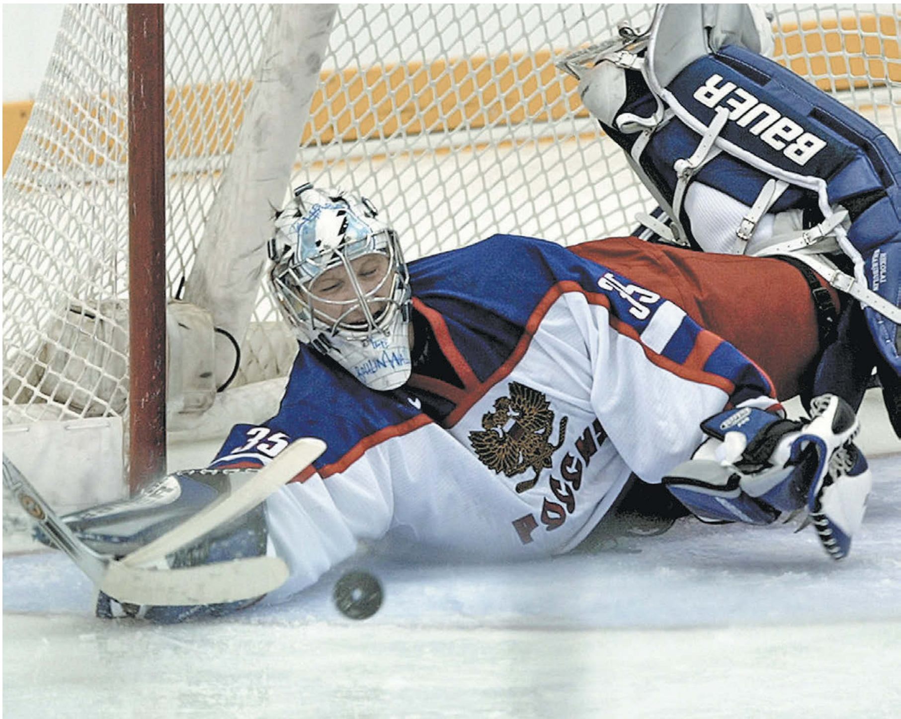
20 февраля 2002 года. Солт-Лейк-Сити. Россия – Чехия – 1:0. Феноменальная игра вратаря российской сборной Николая Хабибулина помогла команде выйти в полуфинал Олимпиады