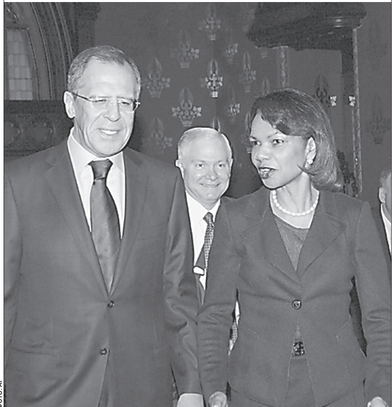
Встреча «2+2»: за внешнеполитические интересы своих стран боролись СЕРГЕЙ ЛАВРОВ и КОНДОЛИЗА РАЙС

— Работа ведется напряженная, — сообщил во время заседания «Известиям» источник, близкий к переговорному процессу. — Идет согласование формулировок документа, прокладывающих основу для новых стратегических рамок отношений. → стр. 2