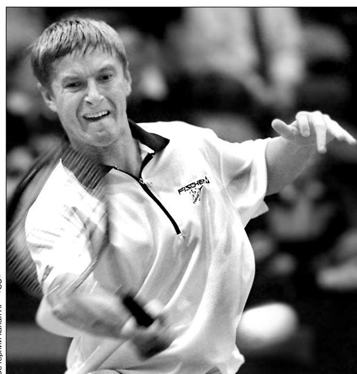
Вчера. Франкфурт. Германия - Россия - 1:1. Евгений КАФЕЛЬНИКОВ побеждает Николаса Кифера и сравнивает счет в матче.