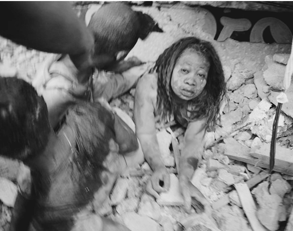
Эту женщину спасатели сумели извлечь из-под обломков. Сотни ее соседей по-прежнему остаются погребенными