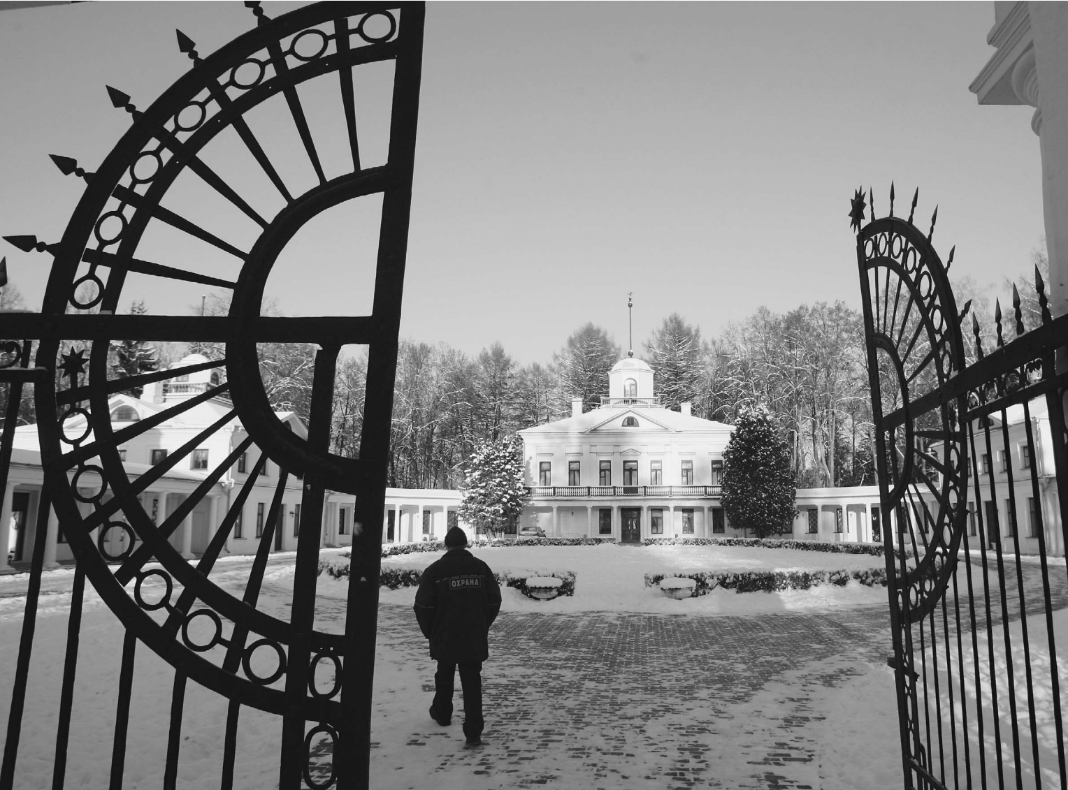
Подмосковье. Национальный лермонтовский центр возрожден силами наследников поэта

Кто защитит музейные усадьбы от рейдеров?