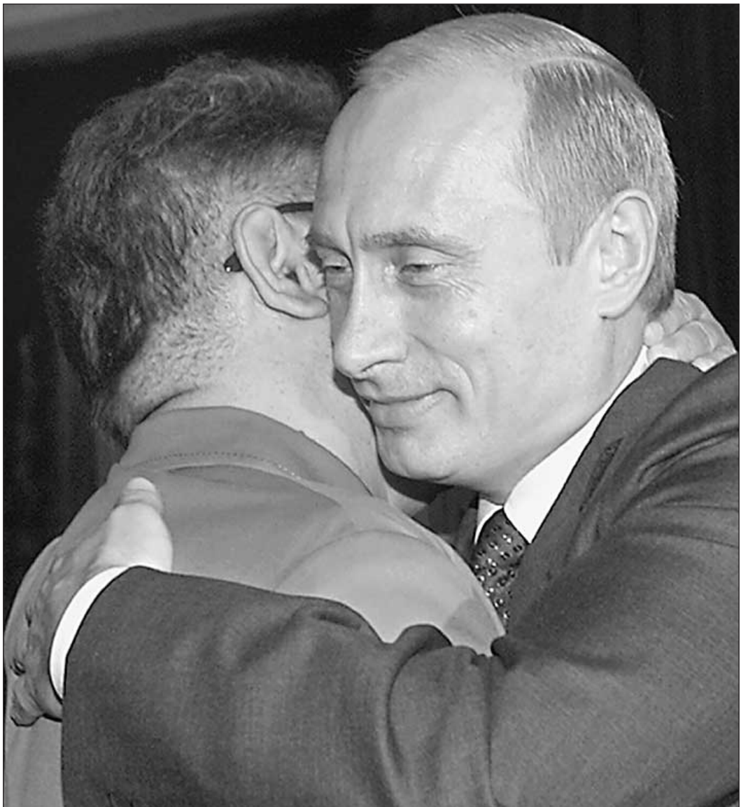
...Владимир Путин и Ким Чен Ир встретились во Владивостоке