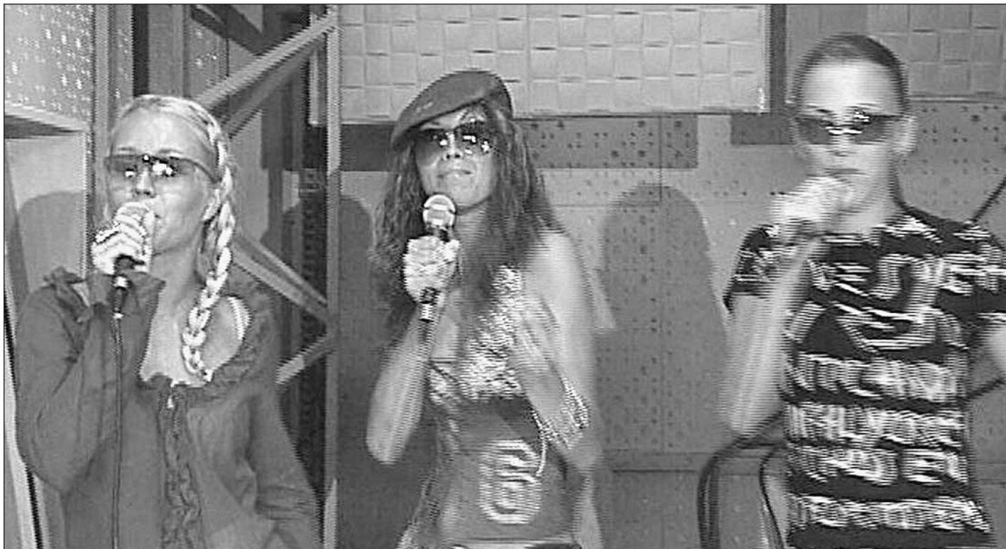
Пока «Поющие вместе» исполняли песню о мужчине мечты...

Владимир Путин уже был героем настенного календаря и политического детектива. Теперь он стал еще и героем девичьих грез и главным — и пока единственным — музыкальным хитом девичьего трио «Поющие вместе».