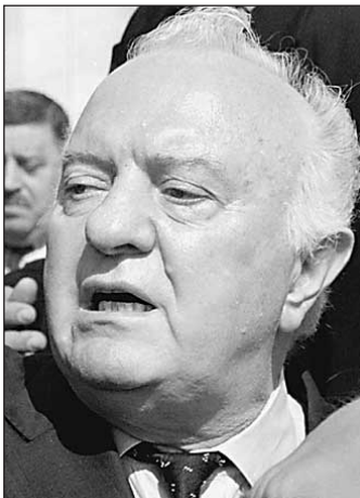
Эдуард Шеварднадзе считает, что Панкиси бомбила Россия