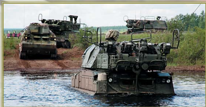
Зенитно-ракетная батарея выходит в указанный район