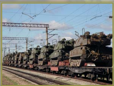
На станцию Домна прибыл эшелон с техникой зенитно-ракетной бригады из Бийска