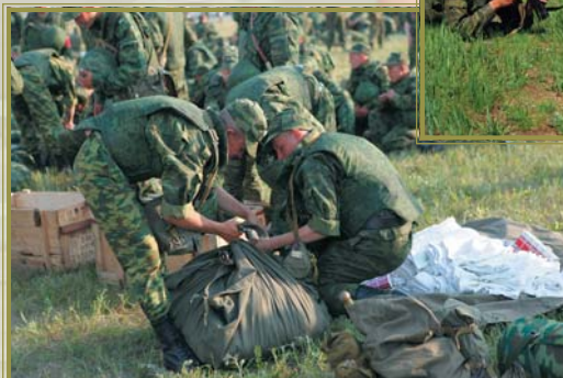
Подразделение мотострелкового соединения готовится к переброске в Дальневосточный регион