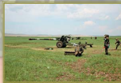
Артиллерия стреляет прямой наводкой