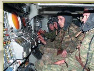
Расчет командного пункта за работой