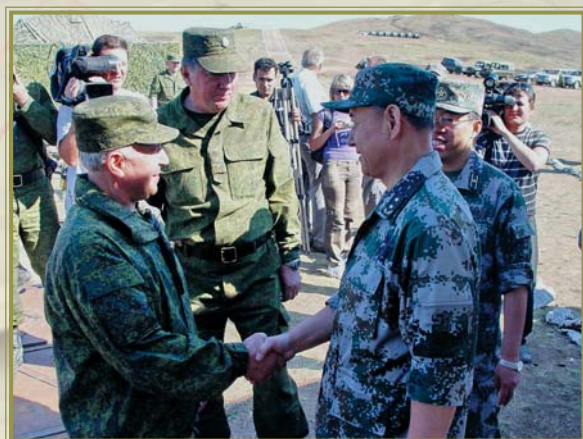
Начальник Генерального штаба Вооруженных сил РФ генерал армии Николай Макаров приветствует прибывшую на этап учения военную делегацию КНР