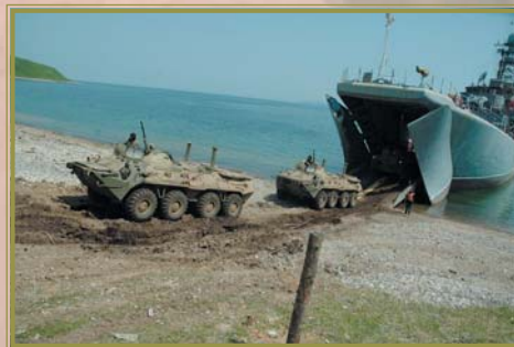
Тренировка по десантированию БТР на Тихокеанском флоте