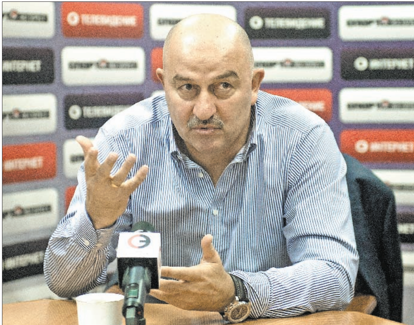
Вчера. Москва. Станислав ЧЕРЧЕСОВ в редакции «СЭ».

- За время вашей работы тренерский штаб попробовал немало игроков, использовал разные модели. Можно ли сказать, что к весне 2017 года эксперименты закончились?