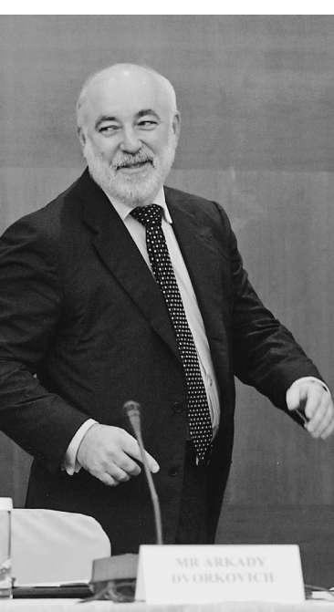
Виктор Вексельберг — сопредседатель инвестфонда «Сколково»

24 ученых с мировым именем из США, Германии и России утром провели первое заседание