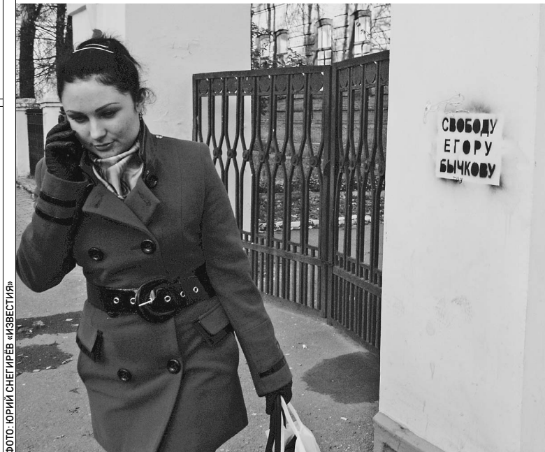
За ночь в уральском городе появились сотни таких надписей