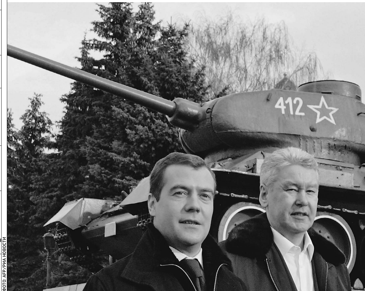
Снимок сделан 27 февраля 2008 года в Нижнем Новгороде. Во время предвыборной кампании Дмитрия Медведева руководителем его избирательного штаба был Сергей Собянин

Сергею Собянину поднимать восстание в Москве ни к чему — он обладает серьезнейшей поддержкой федерального центра и умением решать самые сложные проблемы. О том, каких перемен ждать теперь столице и почему выбор был сделан именно в пользу Собянина, — в статье президента Фонда эффективной политики Глеба Павловского, написанной специально для «Известий».