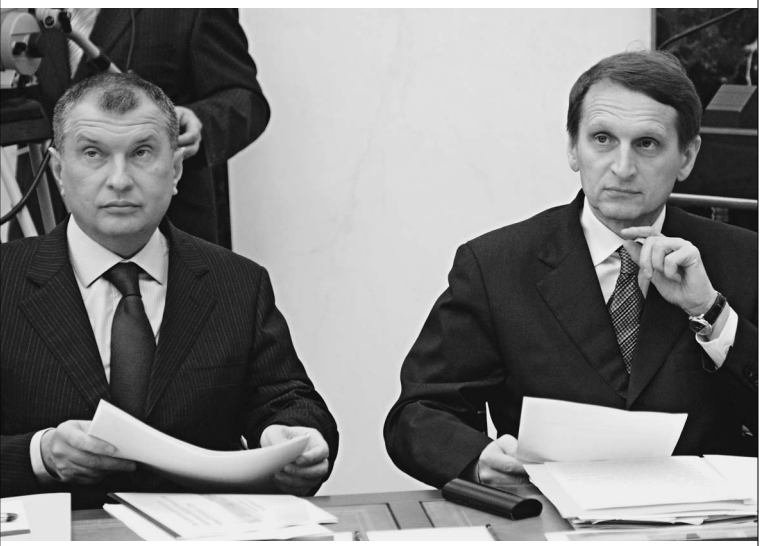
Игорю Сечину и Сергею Нарышкину аппаратная работа хорошо знакома

Но сначала о самой работе, о полномочиях главы аппарата правительства. Они определены в постановлении, подписанном Владимиром Путиным 19 мая 2008 года — практически сразу после его прихода в Белый дом. Итак, руководителю аппарата поручено «вести график работы премьер-министра, обеспечивать представление ему проектов решений и поручений, организовывать работу по подготовке совеща-