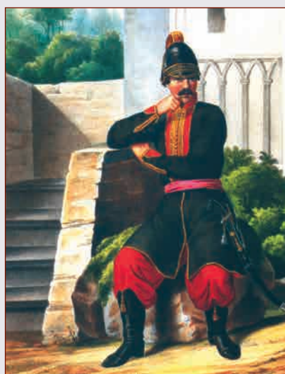
Офицер 1-го батальона Греческого пехотного полка 1779—1797 гг.

Гравюра по рисунку Е.М. КОРНЕЕВА из альбома «Les peuples de la Russie» («Народы России»). 1812 г.