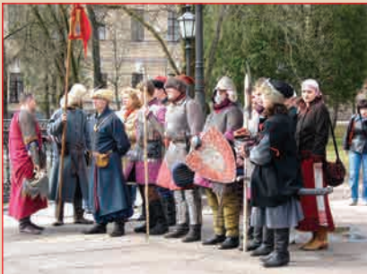
Представление участников фестиваля зрителям