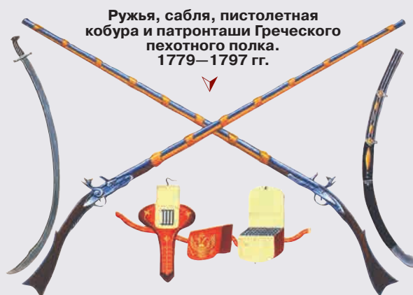
Ружья, сабля, пистолетная кобура и патронташи Греческого пехотного полка. 1779—1797 гг.