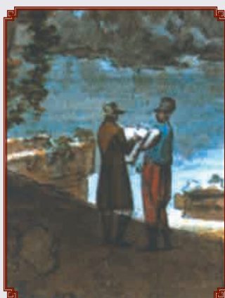
Вид Балаклавского залива Акварель художника Е.М. КОРНЕЕВА, 1804 г. Рядом с художником изображён военнослужащий Греческого пехотного батальона