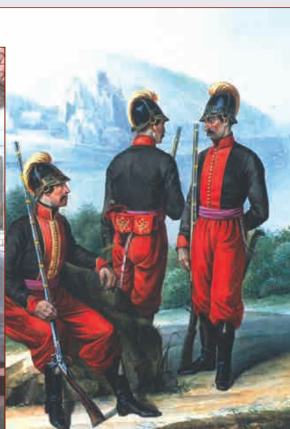
Унтер-офицер и рядовые 1-го батальона Греческого пехотного полка. 1779—1797 гг.