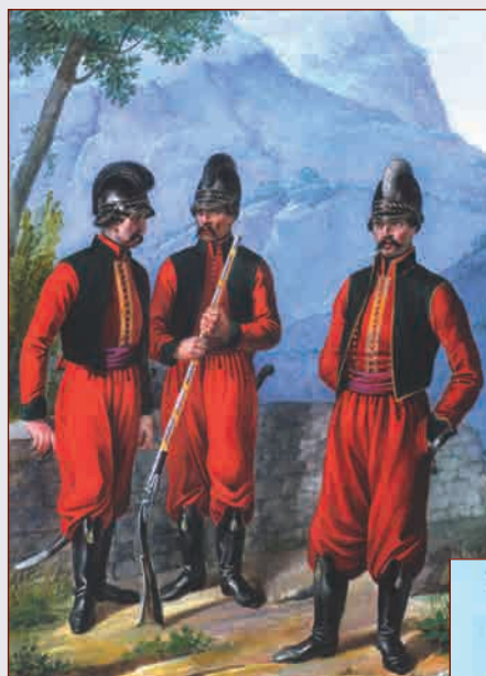
Унтер-офицер, рядовой и офицер 2-го батальона Греческого пехотного полка. 1779—1797 гг.