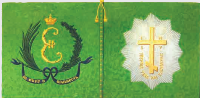
Ротное знамя Греческого пехотного полка образца 1779 г.

Арнаут Раскрашенная гравюра Х.-Г. ГЕЙСЛЕРА 1799—1804 гг. по рисунку, сделанному им во время путешествия по Крыму в 1793—1794 гг.