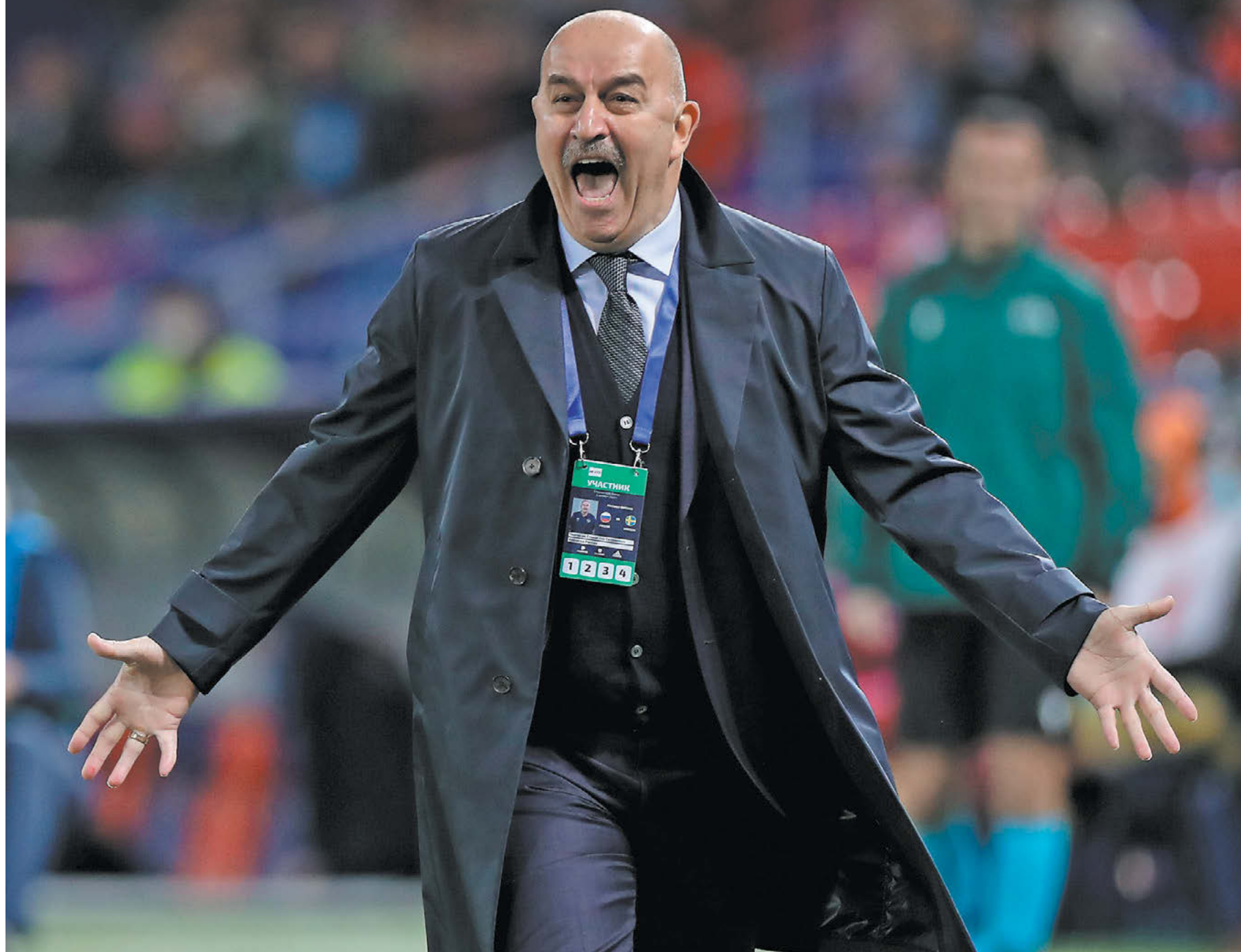
Вчера. Москва. Россия – Швеция – 1:2. Эмоции главного тренера нашей команды Станислава Черчесова

Наша национальная команда потерпела поражение в контрольном матче со Швецией (1:2), но расстраиваться не стоит